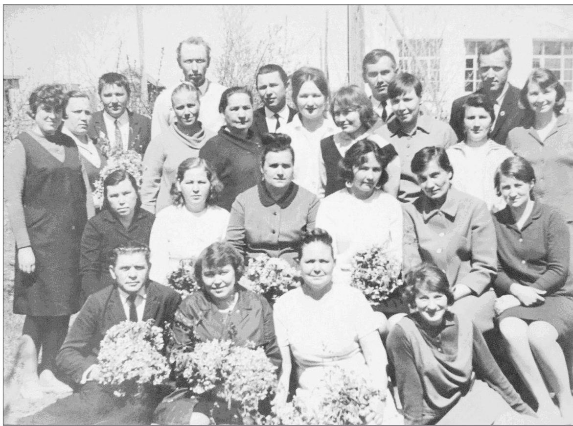
Коллектив Ощепковской СОШ, весна 1968 г.