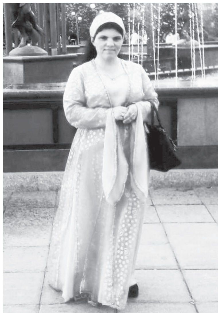
Сайиран по праздникам с гордостью носит национальную одежду.

«Мы любим национальные блюда и русской, и курдской кухни. У нас на столе часто бывают окрошка, пельмени, манты, плов с бараниной, пироги, баурсаки (у курдов они