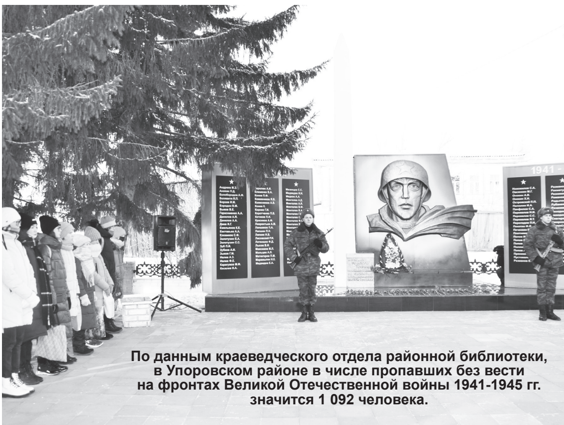
По данным краеведческого отдела районной библиотеки, в Уповском районе в числе пропавших без вести на фронтах Великой Отечественной войны 1941-1945 гг. значится 1 092 человека.

Уповские школьники пришли почтить память своих земляков.