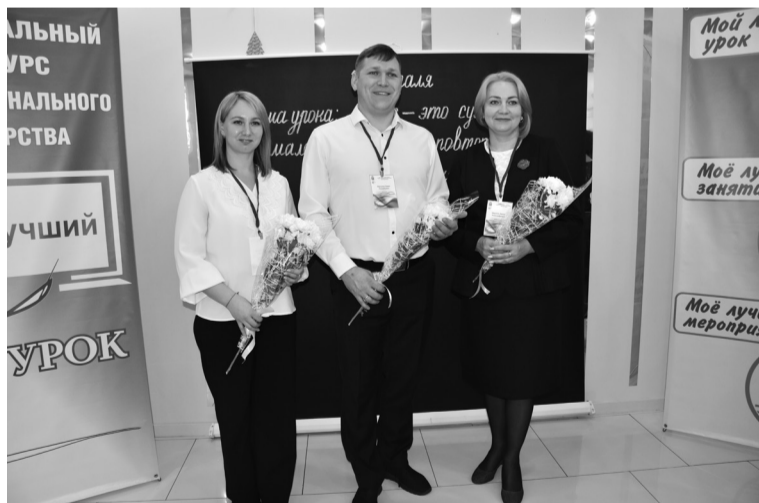
На снимках: участники конкурса

Так, 7 февраля в центре детского творчества состоялось торжественное открытие конкурса профессионального мастерства «Мой лучший урок». Учителя, вос-