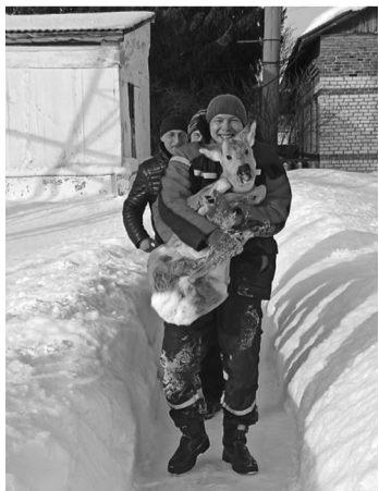
Косули выходят за помощью к людям

Не будем равнодушными – спасём грациозных животных!