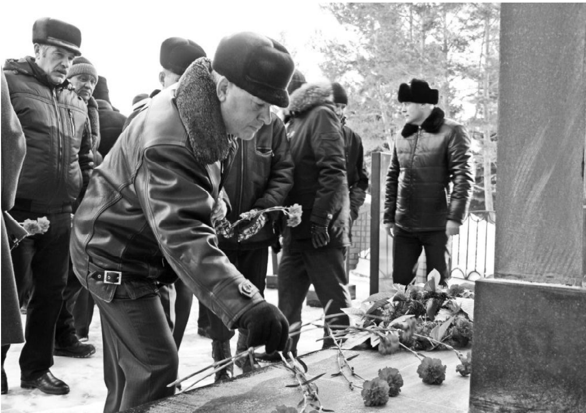
➤ Митинг 15 февраля у Мемориала Славы в Викулово