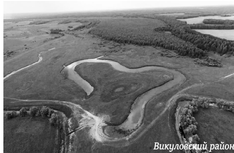
➤ А это наше место влюблённых

Перед путешественником предстает великолепная панорама на пойму реки Ишим, заливные луга и заброшенную турбазу, напоминающую сказочный терем. После восхождения на горы можно спуститься вниз и устроиться на пикник возле