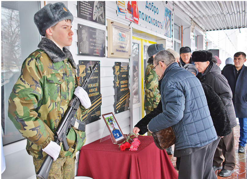
Возложение цветов к мемориальной доске, установленной на фасаде учебного заведения