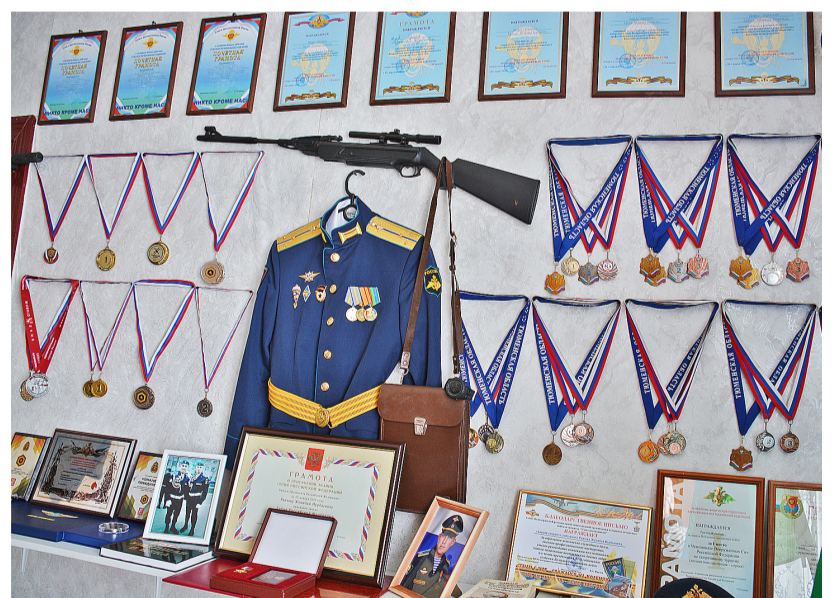
Музейная комната в доме Раизовых