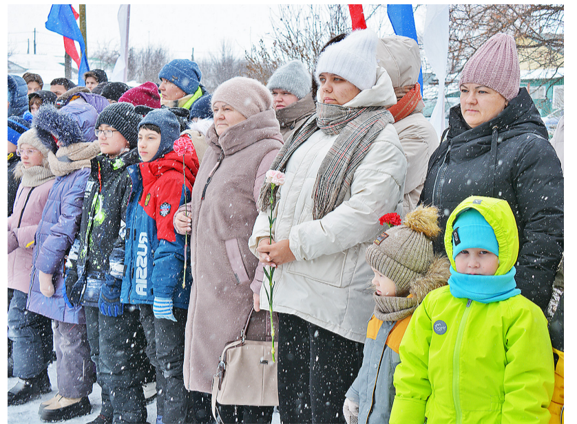
На торжественном мероприятии в Ильинской школе