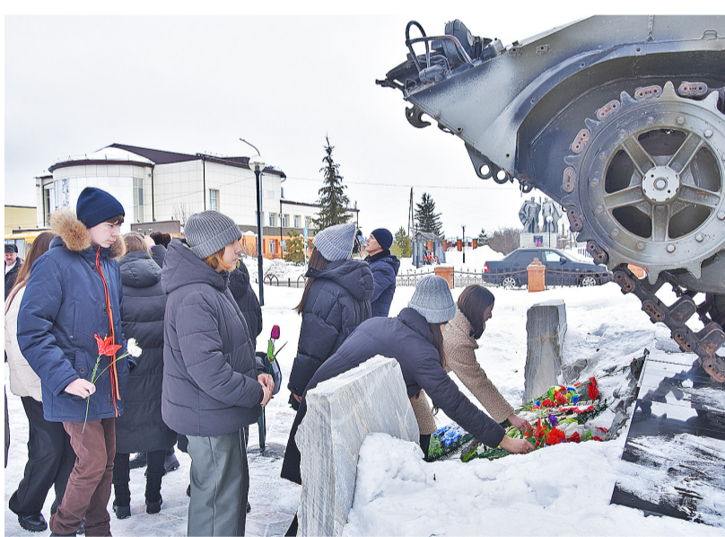
Возложение цветов к памятнику погибшим в боевых действиях и вооружённых конфликтах

За проявленный героизм 22-м военнослужащим было присвоено звание Герой России (21 – посмертно), 69 солдат и офицеров награждены орденами Мужества, из них