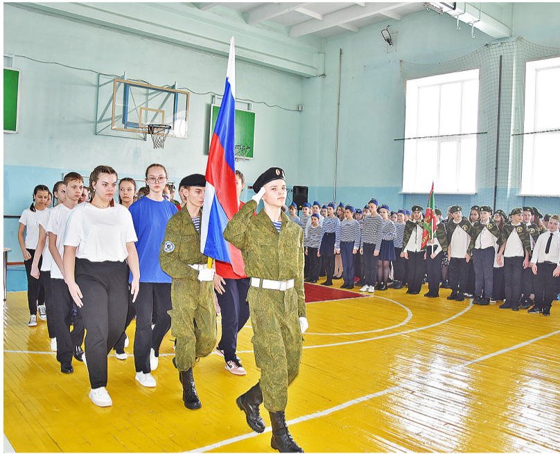
Ребята из 7 «а» класса – победители конкурса