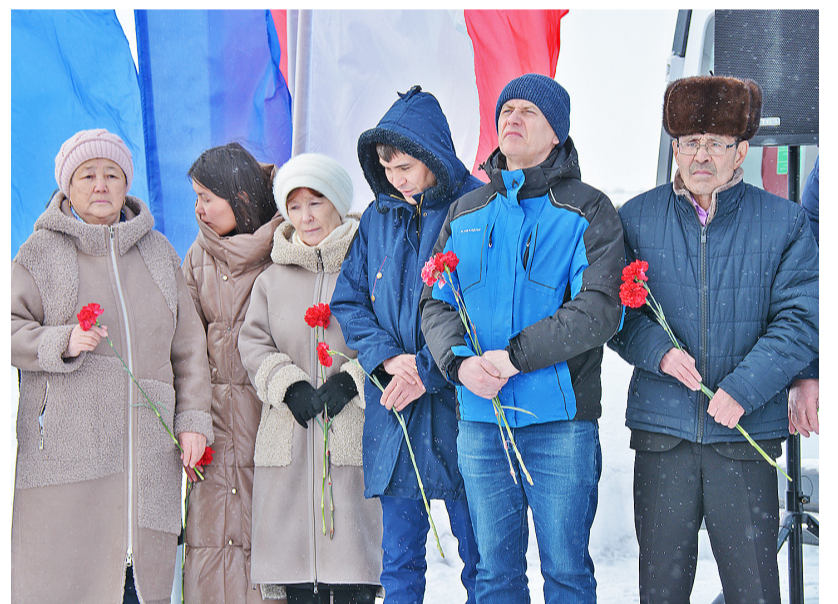
В память о Герое России люди склонили головы