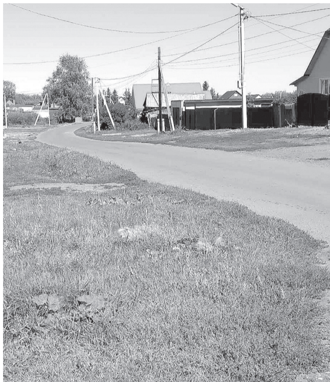
Сегодня Пахомова – красивое село. На восьми благоустроенных улицах: Береговой, Молодежной, Новой, Садовой, Северной, им. Федорова, Центральной, Школьной – стоят добротные ухоженные усадьбы. Истоки малой родины впитывает в себя 591 житель села.

Новая эпоха, новые реалии. Но истинные ценности в семьях всегда передают и перенимают из поколения в поколение.