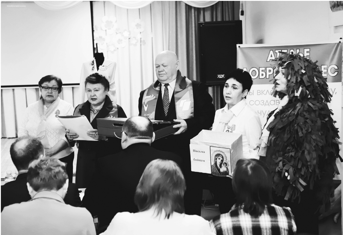
Инициативная группа окружного Совета ветеранов будет помогать бойцам специальной военной операции до Победы

По итогам предварительного отбора к очной защите на традиционных конкурсах гражданских, молодёжных инициатив и профилактических проектов «Воплощай идеи в жизнь» допустили 17 проектов.