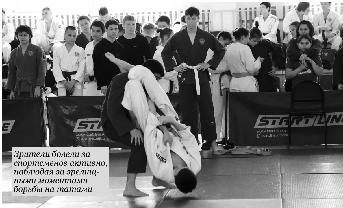
Зрители болели за спортсменов активно, наблюдая за зрелищными моментами борьбы на татами

28 марта на стадионе «Центральный» прошли соревнования по дзюдо в зачёт 29-й Спартакиады учащихся Тюменской области. В них участвовали 16 команд из муниципальных округов и городов юга региона.