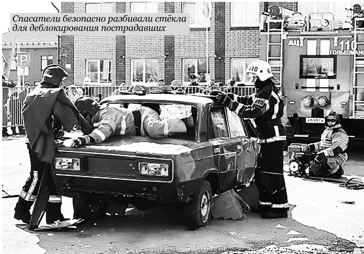
Спасатели безопасно разбивали стёкла для деблокирования пострадавших

По словам организаторов, своевременная помощь попавшим в ДТП – показатель высокого мастерства спасателей.