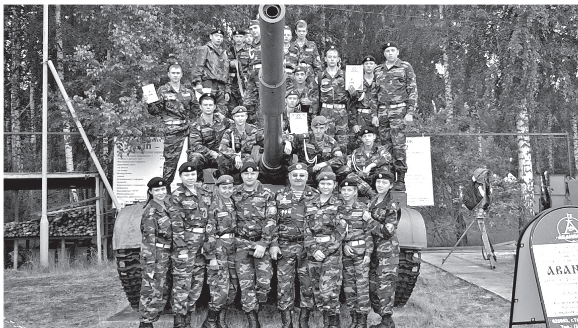
• Группы допризывной подготовки к военной службе популярны у заводуковской молодёжи. Сегодня в городском округе 280 кадетов.

Сейчас у воспитанников специализированных групп небольшая передышка: они набираются сил перед новыми соревнованиями. Уже в начале сентября кадетов ждёт военно-тактическая игра, посвящённая 70-летию Победы.