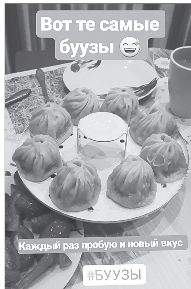
Посетить Бурятию и не угоститься местным традиционным блюдом - невозможно.