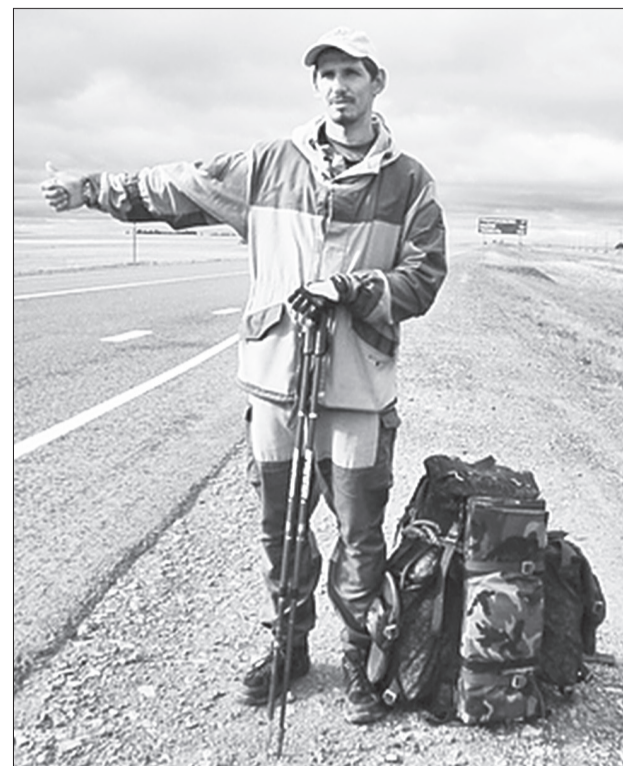
Бывает, что на трассе ждать «своего» водителя приходится по несколько часов