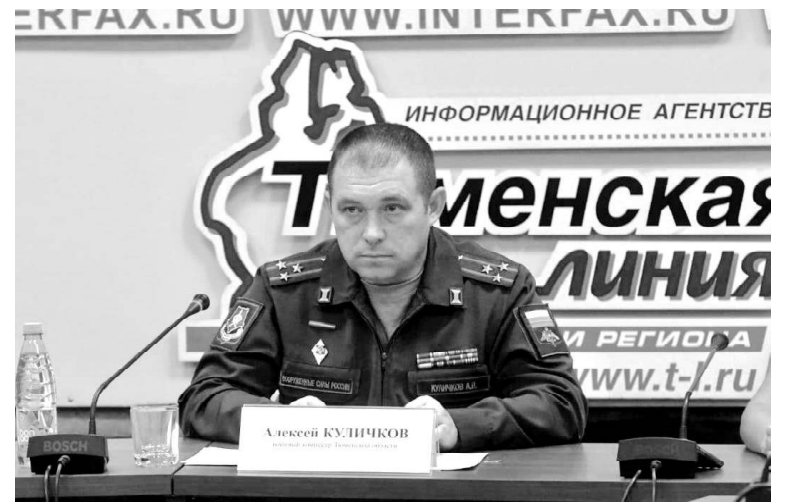
➤ Фото ИА «Тюменская линия»

– На время прохождения военной службы по контракту выплаты пенсий приостанавливаются, после завершения службы – возобновляется. Конечно, воп-