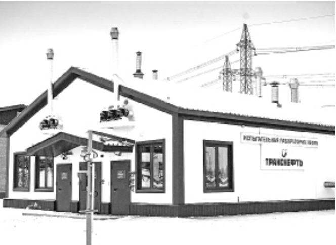
ИЛН – испытательная лаборатория нефти ЛПДС «Демьянское» Тобольского УМН

Люди в белоснежных халатах, столь же белые стены, светлые и просторные помещения, где ничего лишнего, только столы с оборудованием под стеклом, яркий свет и стерильная чистота вокруг – здесь и правда операционная, только не для людей... В новой испытательной лаборатории «препарируют» нефть.