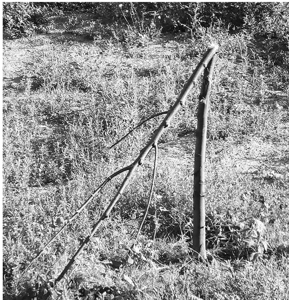
В недалёком будущем эта яблоня могла бы порадовать своими плодами...

Подготовил Алексей ВИНОХОВ по информации управления по благоустройству, озеленению и работе с населением администрации Нижнетавдинского района.