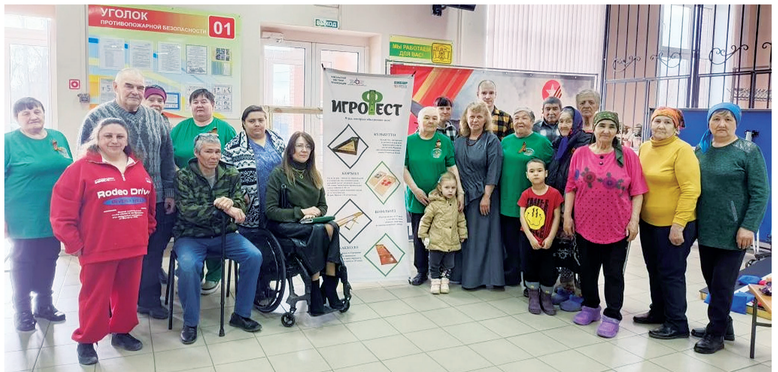
► Мастер-класс проекта «Игрофест» прошёл в Байкалово

Лидер РО ВОИ поделилась также, что первоначально в