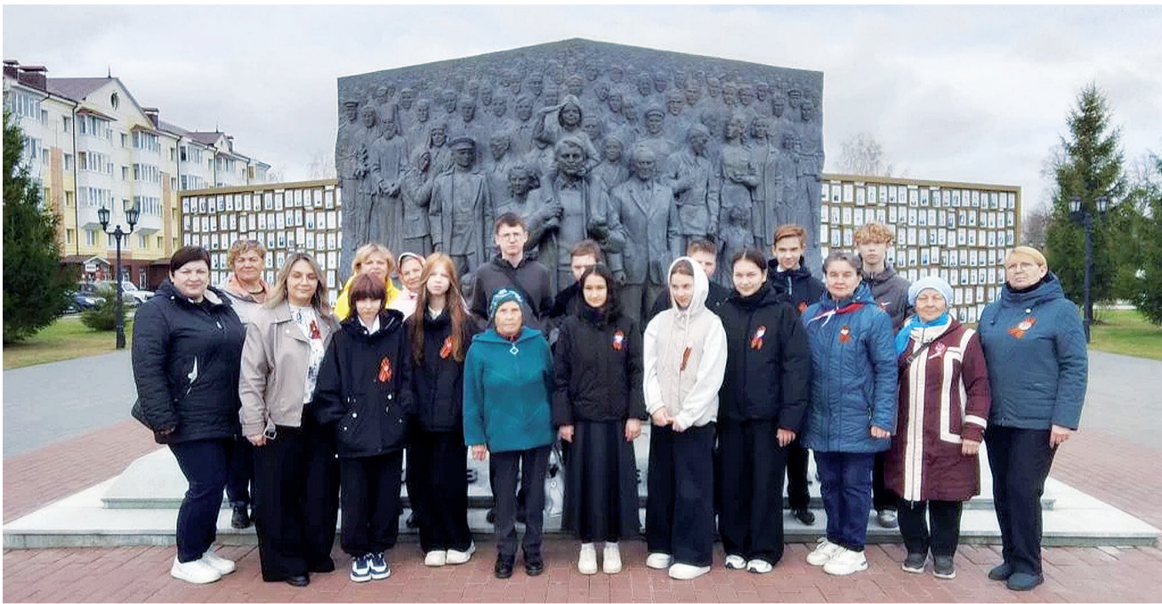
► Площадь Победы – место памяти и славы.