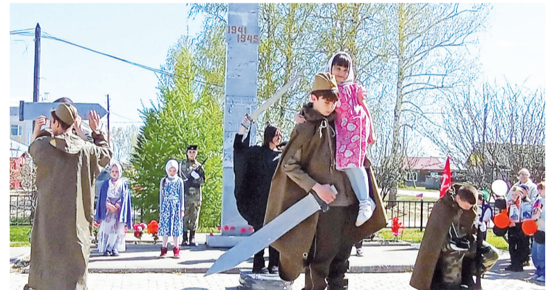
► Композиция «Память» в Сетово.

Незабываемое впечатление оставила композиция «Память», подготовленная школьниками. Каждый образ её, костюмы, атрибуты, позиция продуманы до мелочей, и благодаря этому она