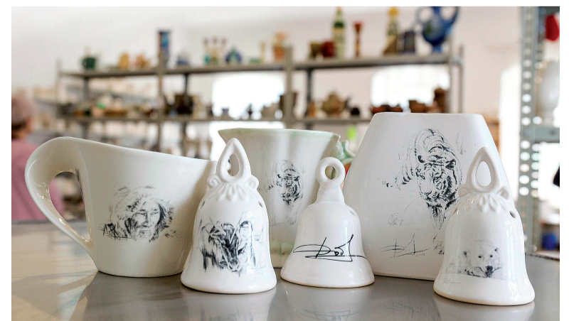
► Новая техника: фарфор изящный и живой