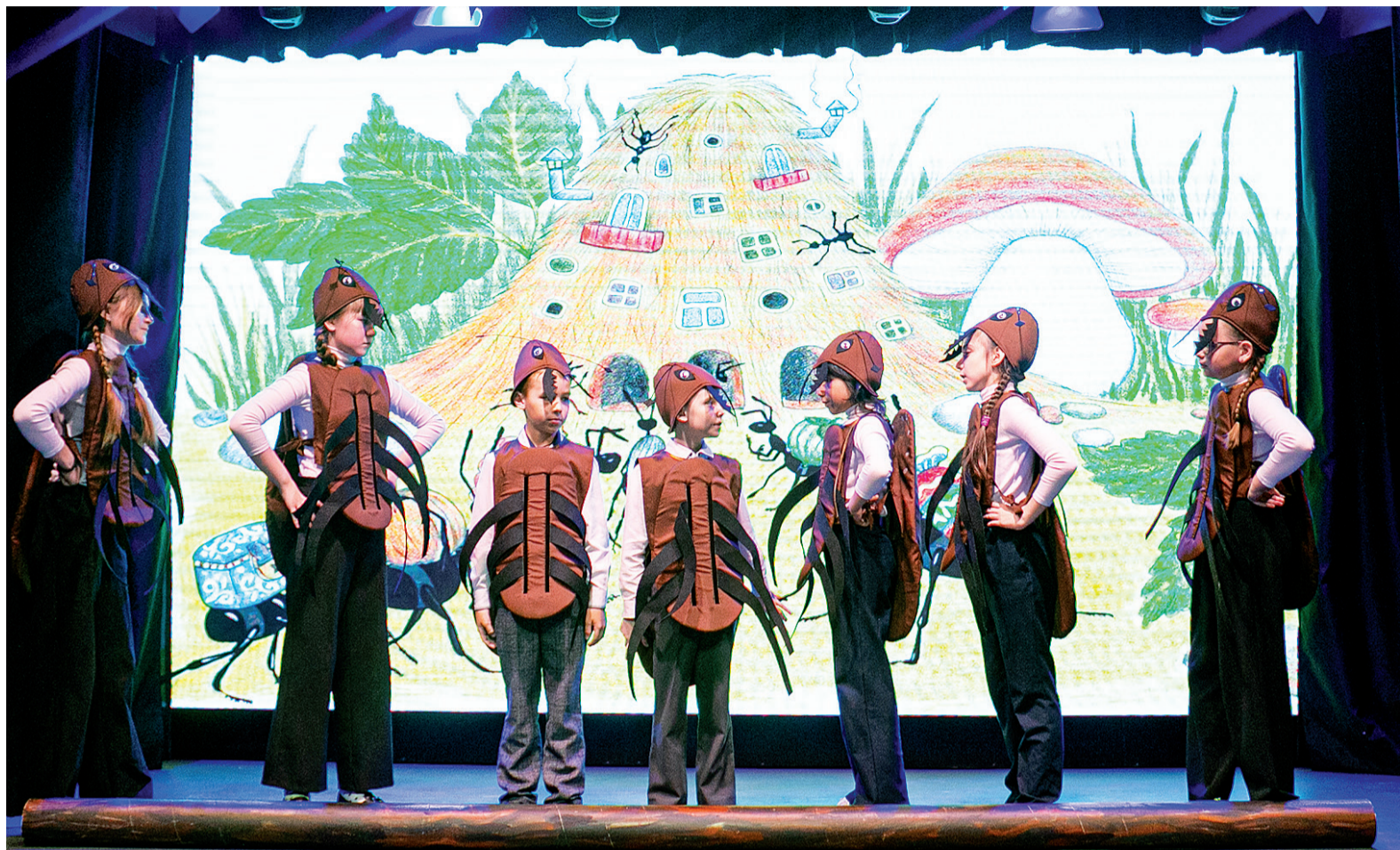
► Муравьи в исполнении артистов «Балагана».

– Младший состав театрального коллектива «Балаган» – насто-