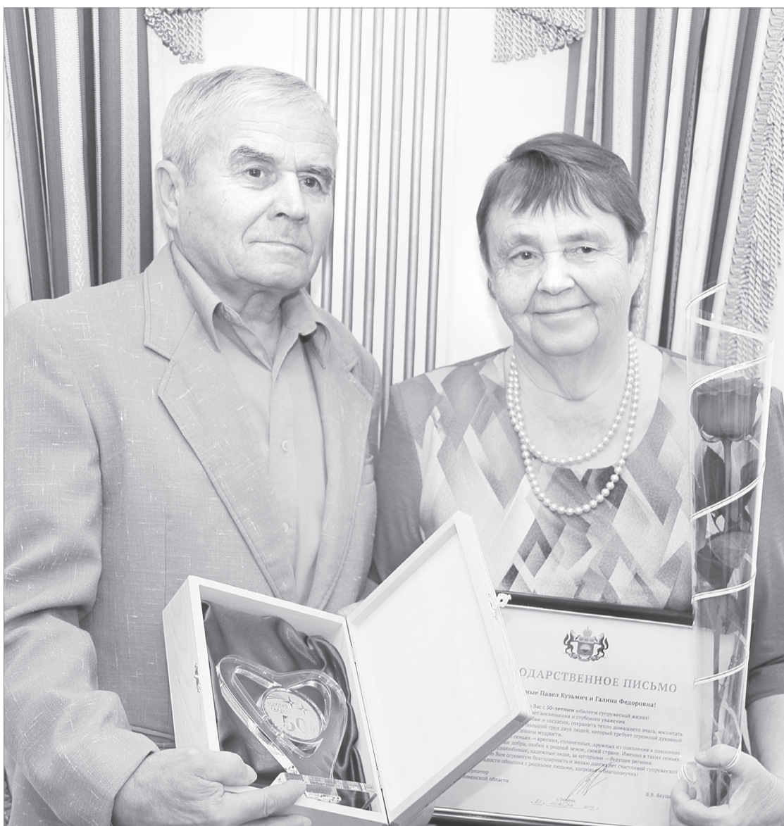
- Только уступая друг другу, мы дожили до золотой свадьбы, - говорят супруги Фёдоровы