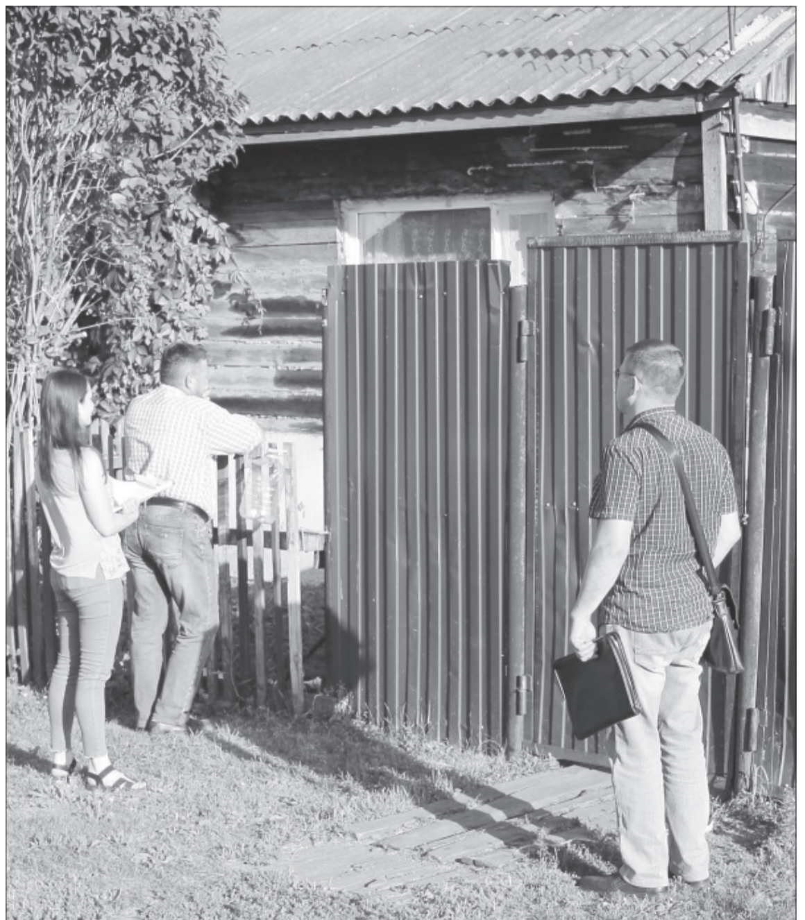
Некоторые абоненты общались со специалистами МП «Строй-Проект» только из-за закрытой калитки

За что платить? В прошлую пятницу, ближе к 19 часам, когда у большинства селян закончился рабочий день, бригада из главного инженера, специалистов абонентского и юридического отделов отправилась по деревенским дворам. В одном из них по документам значилось использование скважины, но выяснилось, что здесь имеется колодец, в котором вода далеко не питьевая. Хозяин не стал скрывать, что в пищу использует воду из ближайшей колонки, но о том, что за это нужно платить, не слышал. Он пояснил, что набирает 40-литровую флягу раз в два дня и интересовался, как будет учитываться потребление после заключения договора. Специалисты пояснили, что плата взи-