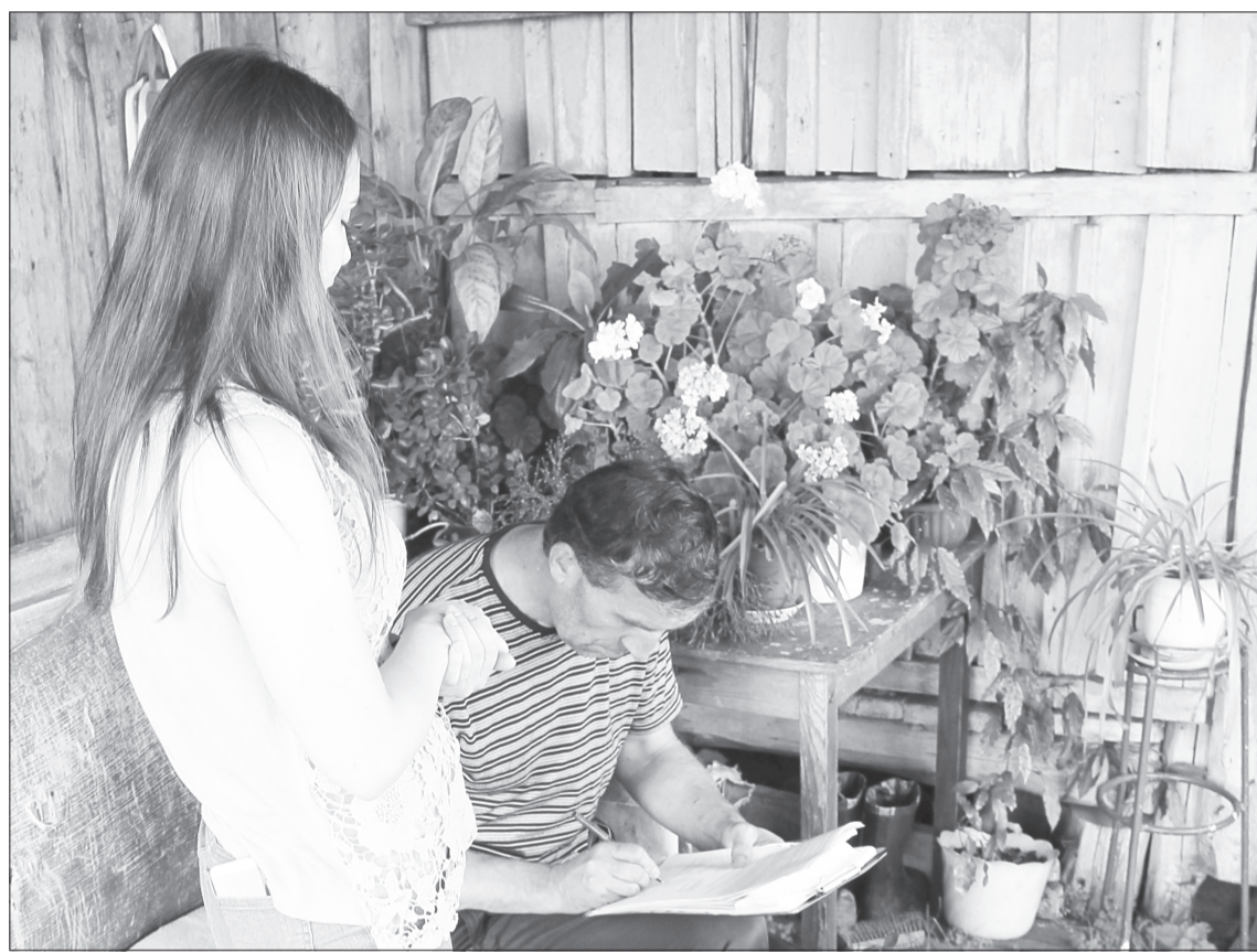
В ходе рейда были заключены два договора на пользование водоразборными колонками. Документы оформили на месте, а ушло на это буквально пять минут

На одном из адресов специалистам абонентского отдела цифры на водосчётчике показались подозрительными. Во дворе перед комисси-