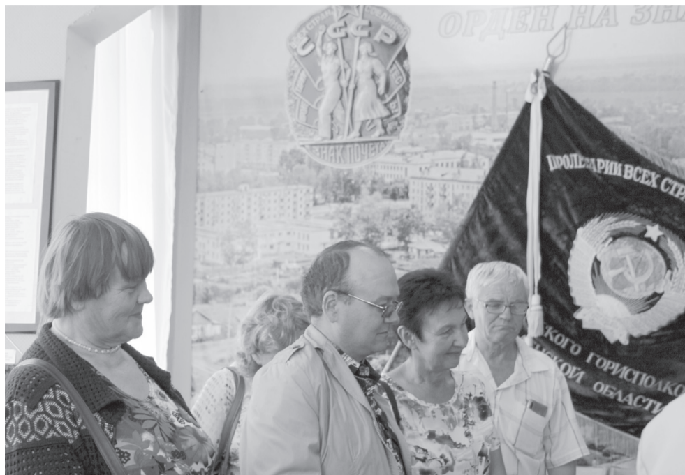
Центральная стена музейного зала украшена знаменем Ишимского горисполкома, на котором прикреплен орден «Знак Почёта». Под ним в витрине – отписки документов: Указа и Грамоты от 10 августа 1982 года Президиума Верховного Совета СССР о награждении Ишима «Знаком Почёта» с подписями председателя Леонида Ильича Брежнева и секретаря Михаила Георгадзе, многочисленные поздравительные телеграммы.

Вот такие ковровые дорожки производились массово десятками метров. В 1980-х Ишимская ковровая фабрика выполняла важный госзаказ – поставку продукции для залов московского Кремля. На фоне атрибутов социалистического сорев-