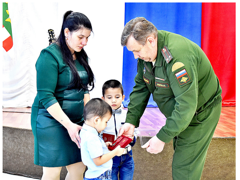
Момент вручения государственных наград

кын героически погиб от осколочного ранения.