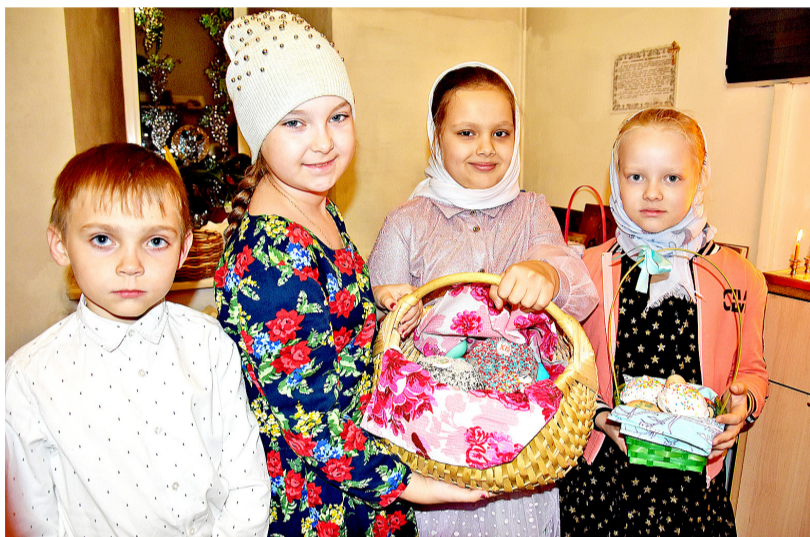
После праздничной литургии детям по традиции раздают освящённые пасхальные яйца

Существует ещё одно предание, которое гласит, что первой раскрашивать варёные яйца в разные цвета начала Дева Мария. С помощью них она развлекала Иисуса, когда он был ещё младенцем. По третьей версии, обычай красить яйца появился из-за необходимости защитить продукт от порчи. Великий пост длится 40 дней, и что-