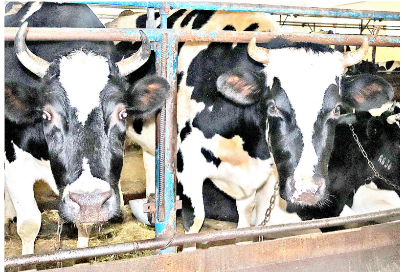
В селекционной работе важно оценивать продуктивные и племенные качества животных

Бонитировка дойного стада позволила увидеть статистику высокоудойных коров. Так, бурёнок с продуктивностью от 8000 килограммов и выше в районе насчитывается 734 головы или 34% от общего поголовья. Существует ещё и такое понятие, как золотой фонд отрасли, это коровы с рекордным уровнем продуктивности более 10 000 килограммов молока в год. Их число за 2022 год составило 213 голов (7,5% к поголовью коров с последней законченной лактацией). Наибольшее количество десяти-