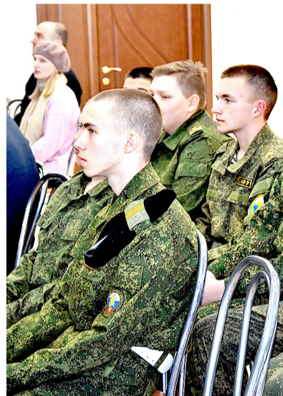
Отважные поступки героев-земляков – хороший пример для молодёжи