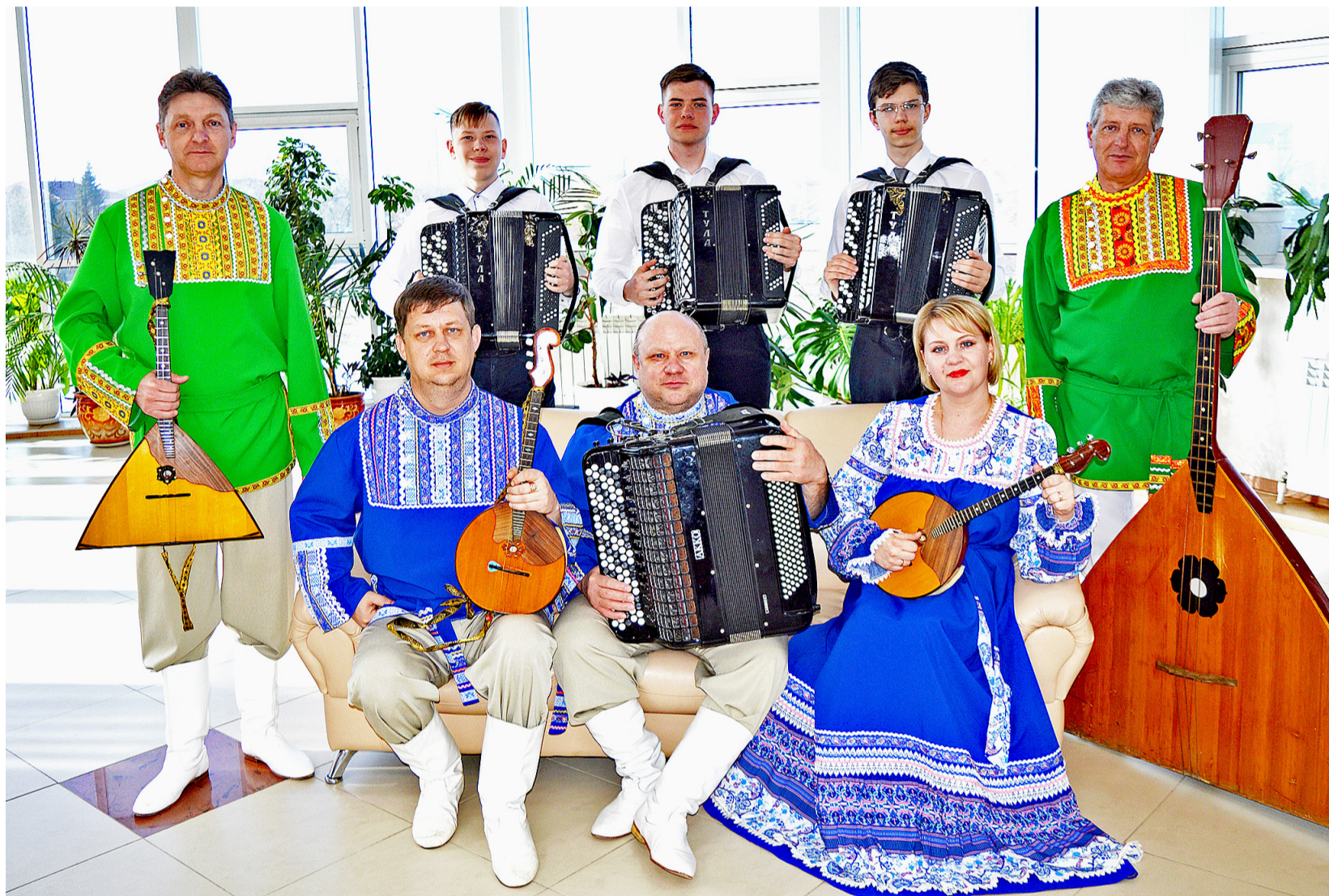
Коллектив любительского художественного творчества ансамбль народных инструментов «Былина»

Ансамблю народных инструментов «Былина» в марте присвоено звание народного коллектива любительского художественного творчества, а в апреле музыканты выиграли конкурс на получение гранта в размере 300 тысяч рублей на улучшение материальной базы коллектива.