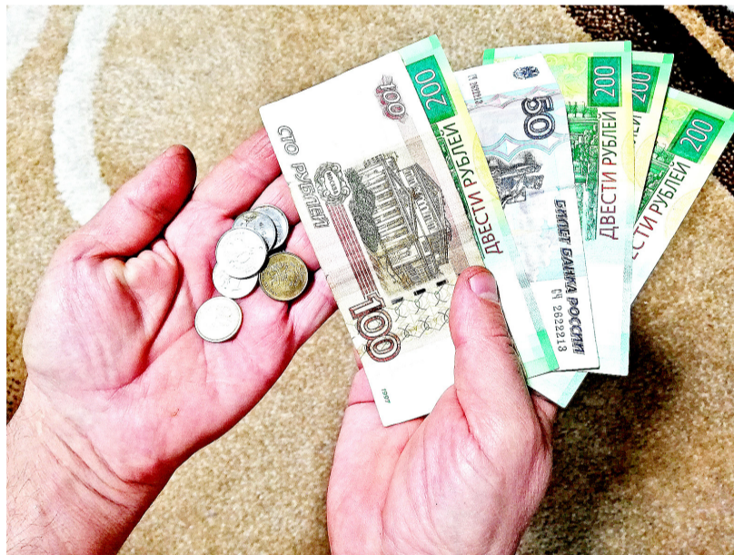
Родители несут ответственность за своих детей