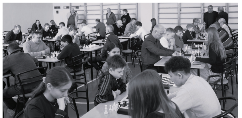
Шахматное состязание собрало любителей чёрно-белых баталий из разных уголков Тюменской области.