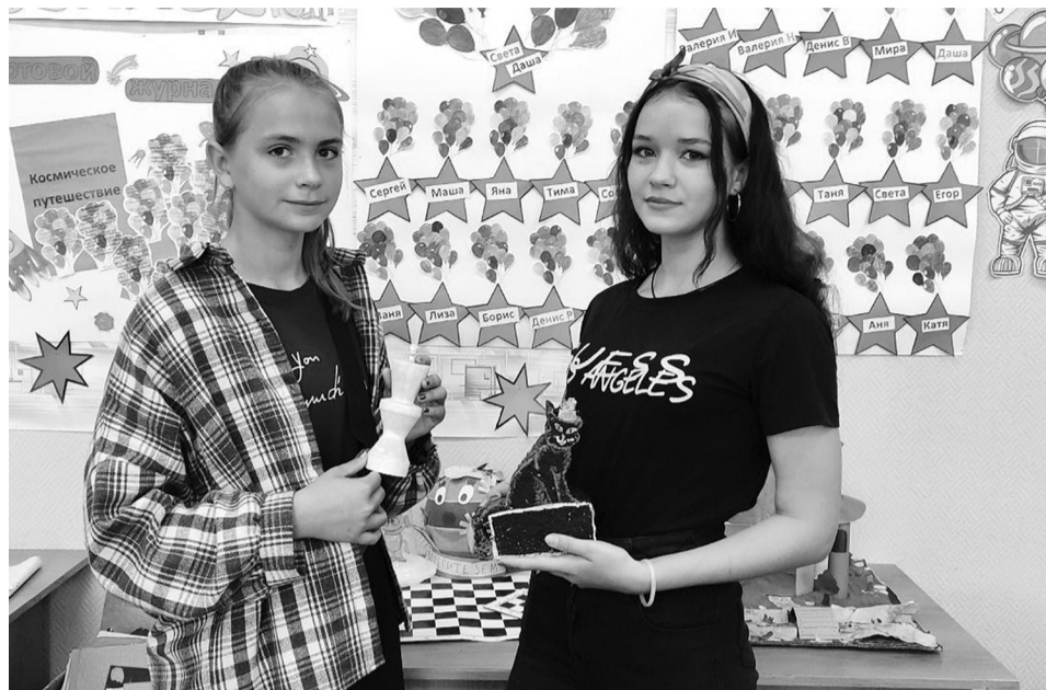
Ежедневно в лагере оформляются выставки детских работ

Конечно же, ребята "путешествовали" по планетам, но не тем, о которых известно каждому из нас, а по фантастическим. Самые активные участники всех мероприятий и со-