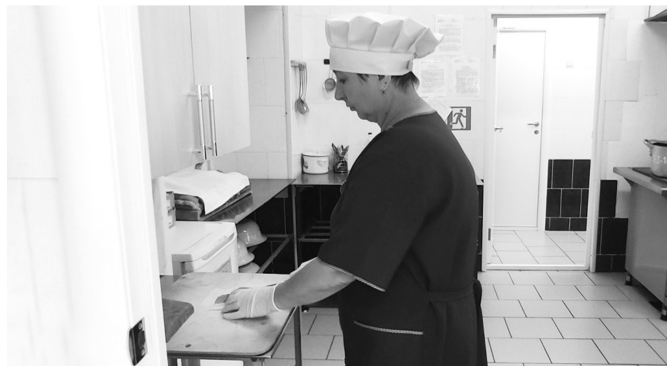
Питание в лагере вкусное и разнообразное