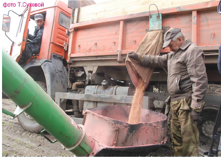
➤ Загрузка семян.