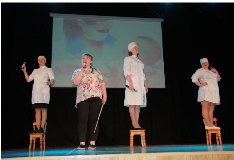
➤ Выступление викуловских медсестёр в г. Ишиме // Фото из архива больницы.

— Казалось бы при сегодняшней загруженности, когда вся