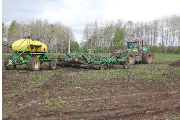
➤ Сев идёт.