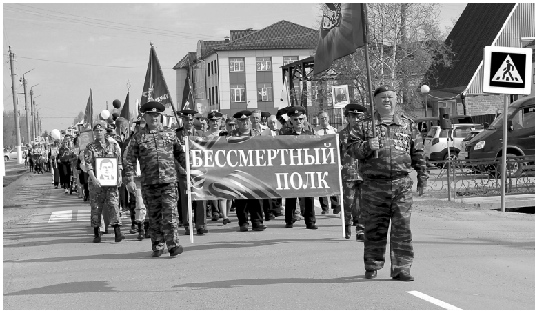
После двухлетнего перерыва голышмановцы вновь смогут принять участие в шествии «Бессмертного полка»

Вечером, в 18:30, на площади у центральной библиотеки соберутся участники «Бессмертного автополка». На центральной площади в 19:00 часов будет выступать группа «От Афгана до Чечни». Вечерний концерт артистов голышмановской сцены завершит акцией «Свеча Памяти» в 21:30. Руководитель штаба местного