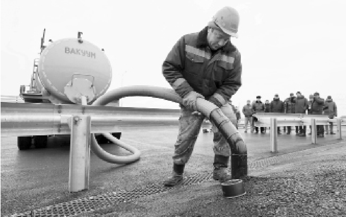
Амбициозный проект – прокладка веток коллектора под дном Иртыша