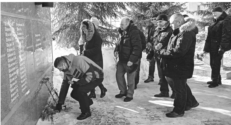
Поклонимся и мёртвым, и живым...

В День памяти о россиянах, исполнявших служебный долг за пределами Отечества, в посёлке у мемориального комплекса состоялся митинг.