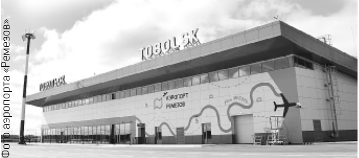
Фото аэропорта «Ремезов»

В Тобольске в ежедневном режиме исследуют состояние атмосферного воздуха. В рамках общественного контроля тоболяки наглядно увидели работу мобильной экологической лаборатории