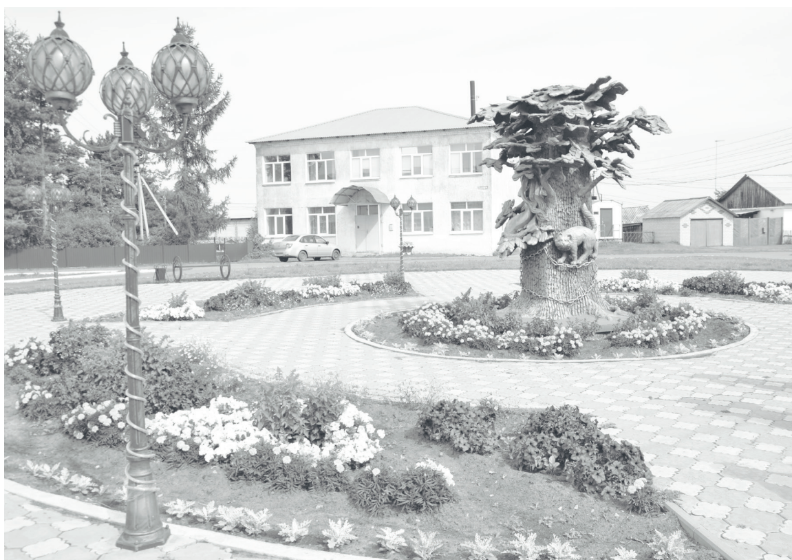
Площадь перед Домом культуры в Суерке – любимое место отдыха сельчан.

Екатерина ОГНЁВА, Надежда ШИШКИНА