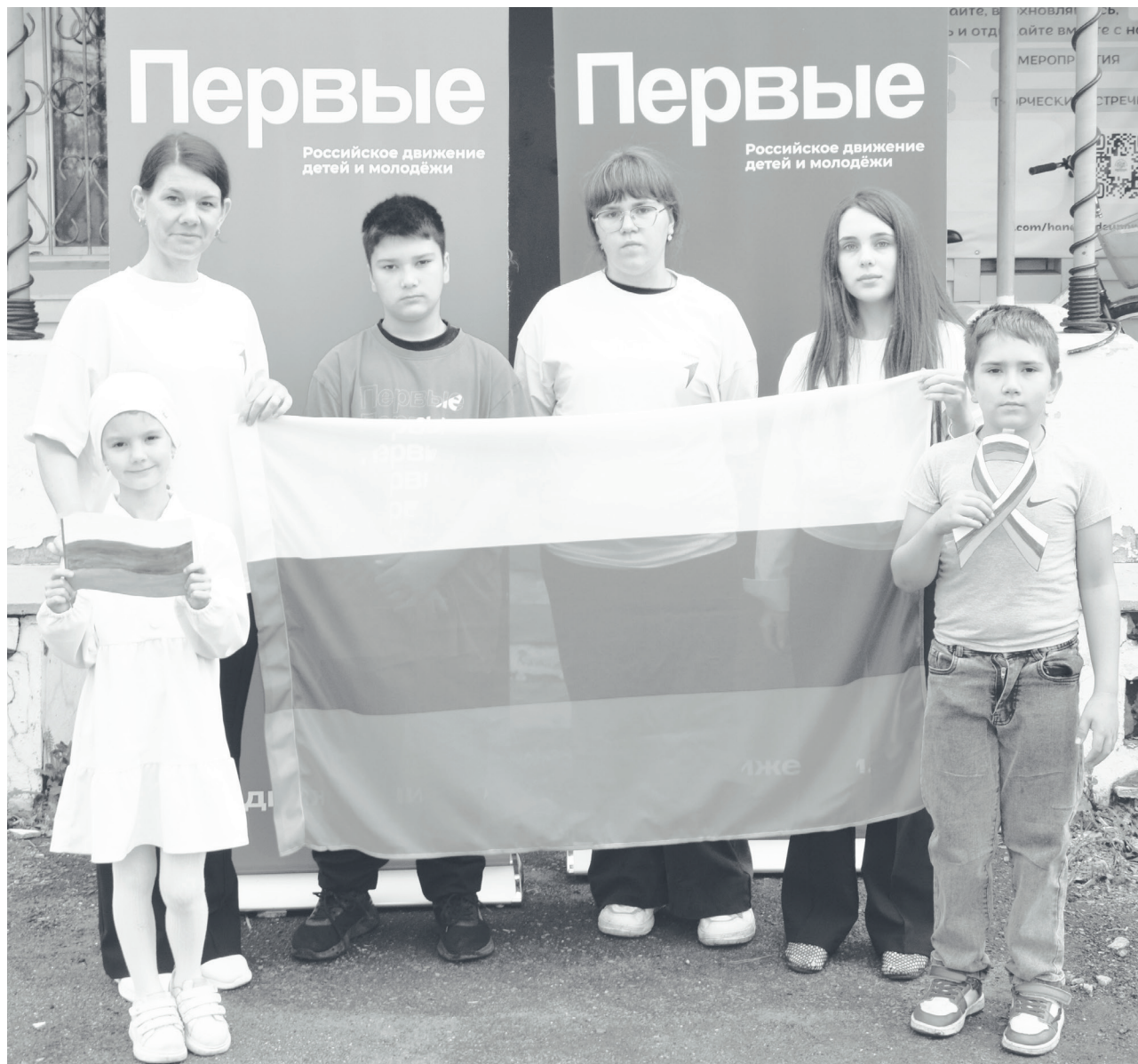
Ребята из Движения Первых готовятся к акции, посвящённой Дню Государственного флага Российской Федерации.