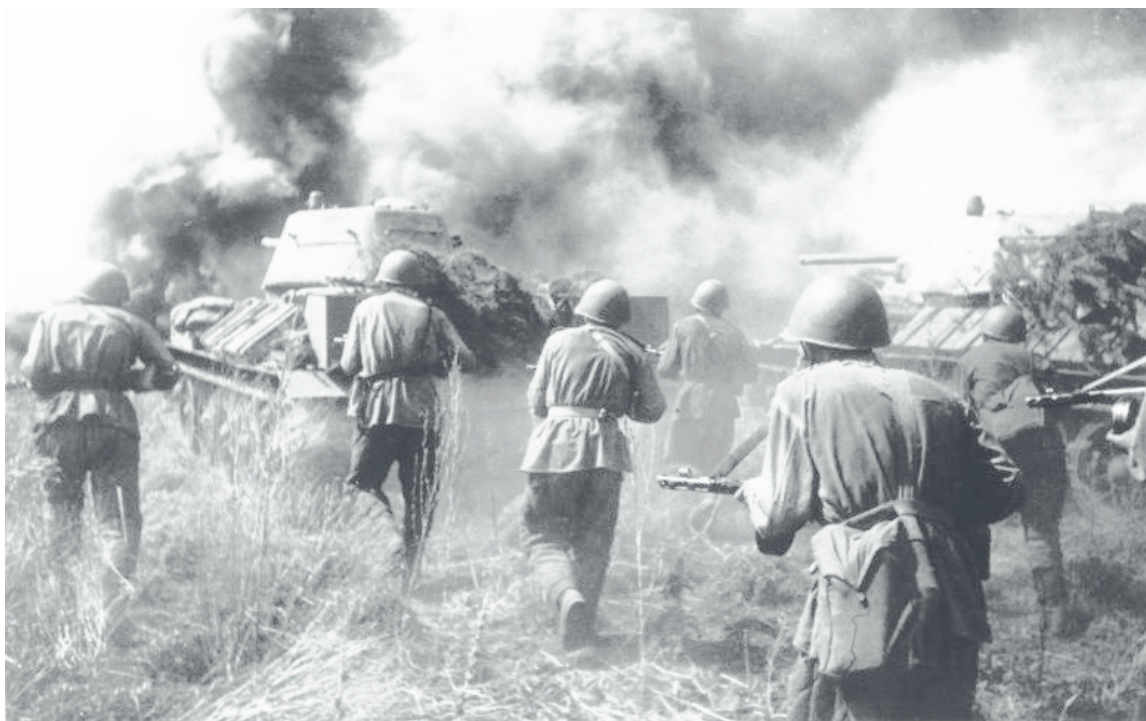
Советская пехота и танки Т-34 в наступлении во время боев на Курской дуге.

В столкновении с советскими войсками участвовали более