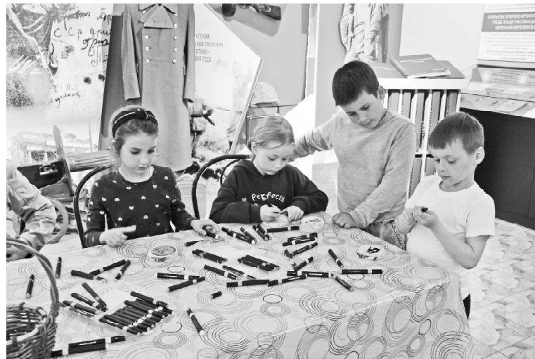
➤ Мастер-класс «Сибирский быт»