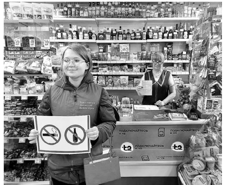
› Рейды по торговым точкам