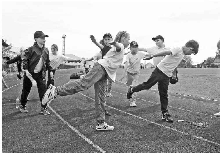
› Слёт «В поисках пионерского галстука» // Фото Татьяны СУХОВОЙ