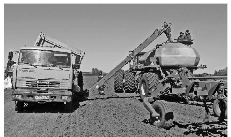
➤ Загрузка семян