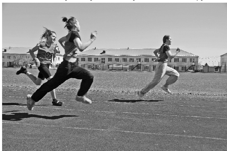
» Моменты фестиваля ГТО в Викулово