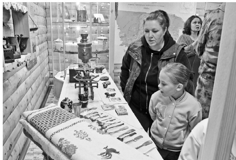
➤ Импровизированная гостинная