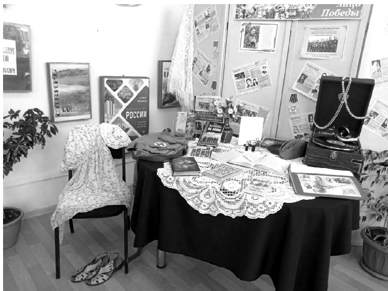
› Выставка в центральной библиотеке

В годы Великой Отечественной наряду с мужчинами весомый вклад в Победу внесли и женщины. Они служили на передовой снайперами, лётчицами, зенитчицами, освоили множество других военных специальностей. В тылу заменяли ушедших на фронт мужей и братьев, сутками стояли у станков, вели хозяйство и всеми силами помогали Красной Армии.