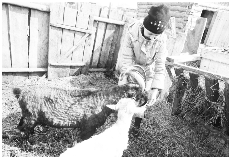
Одна из присланных работ из Емуртлинского поселения.

Продолжается приём фотографий и стихов о зиме на редакционные конкурсы «Зверьё моё» и «Белая сказка». Мы получили несколько поэтических произведений и ещё больше прекрасных фотографий селян с любимыми животными. До завершения приёма работ осталось две недели. Предлагаем потенциальным участникам настроиться на праздничный творческий лад и любимым доступным способом прислать нам письмо с фото или стихами.