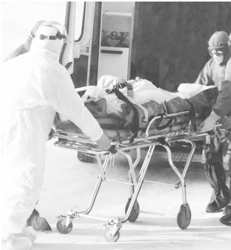
С коронавирусом приходится бороться в нелёгких условиях.

Эпидемиологическая ситуация, связанная с пандемией новой коронавирусной инфекции, остаётся напряжённой. В Тюменской области на 1 декабря текущего года развёрнуто 18 моноинфекционных госпиталей более чем на 3 500 мест.