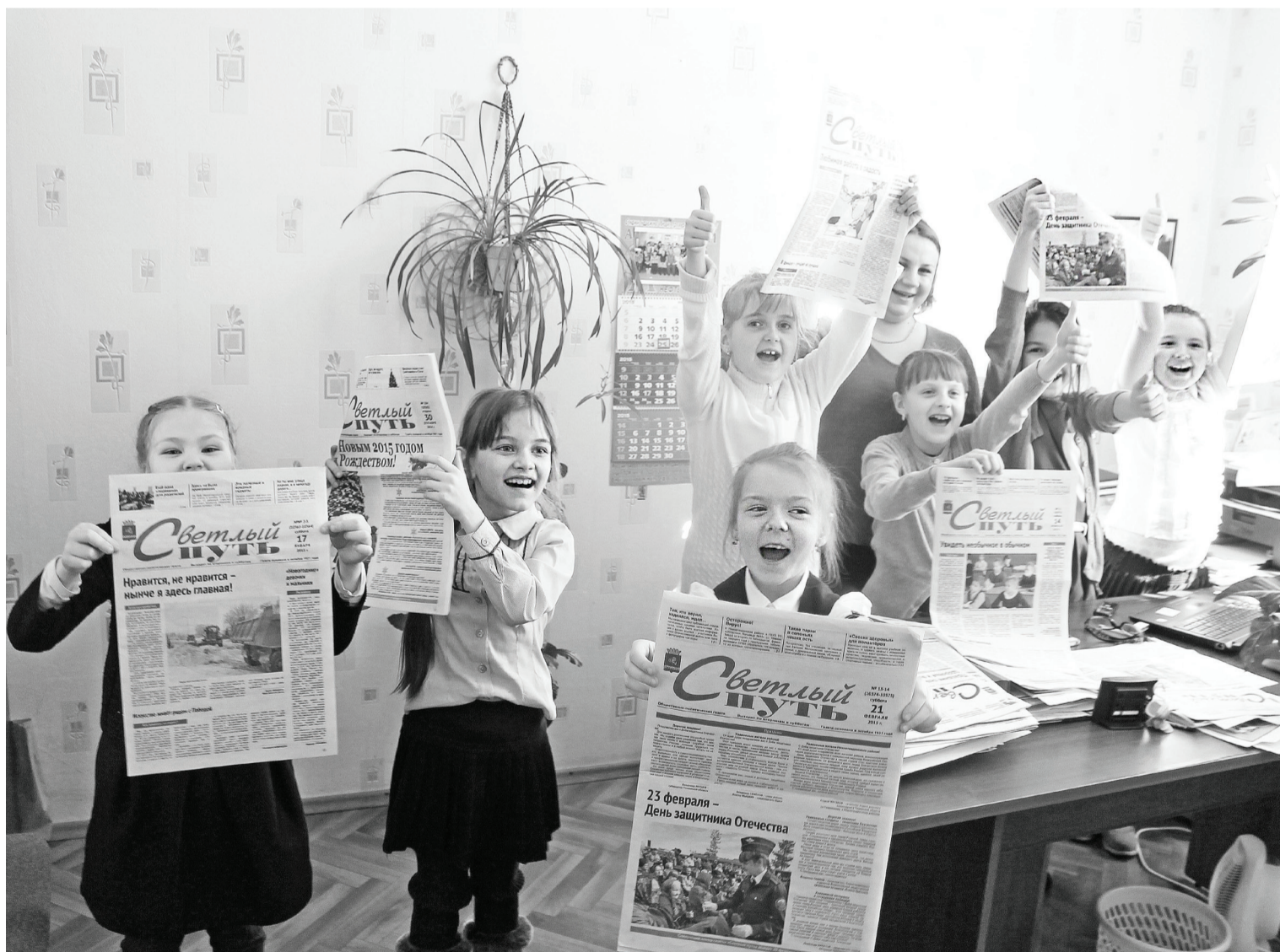
Газета «Светлый путь» просто класс!

У нашей районки богатая история. Чем была интересна жизнь десять, двадцать, пятьдесят лет назад? Открой подшивку старых газет – с пожелтевших страниц к тебе вернутся события, факты, запечатлённые моменты и лица людей – бесценная память! Жизнь так быстро меняется, и это движение времени может запомнить и сохранить газета.