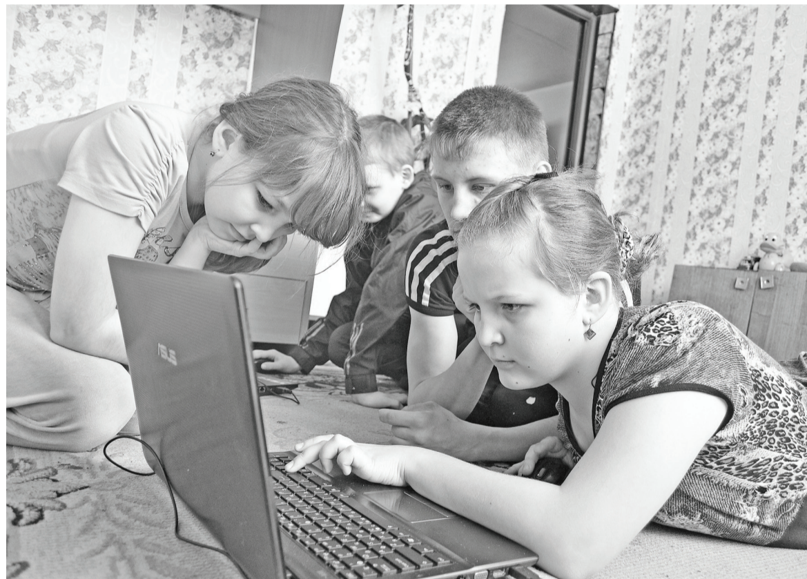
Не разлей вода: даже за ноутбуком вместе и никому не тесно.