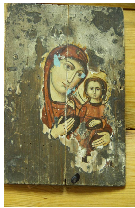
Старинная православная икона