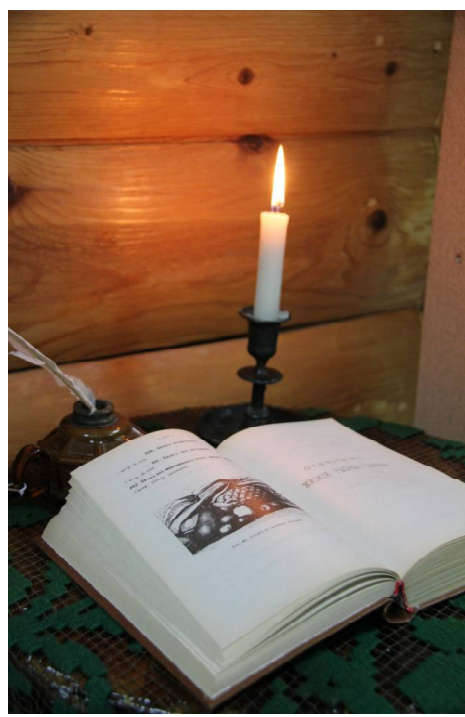
Листья пожелтевшие страницы...