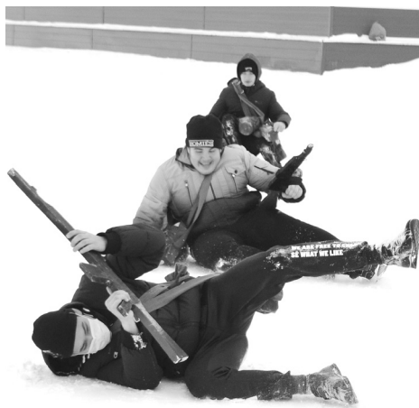
По команде "Вспышка слева" весь класс рухнул в снег