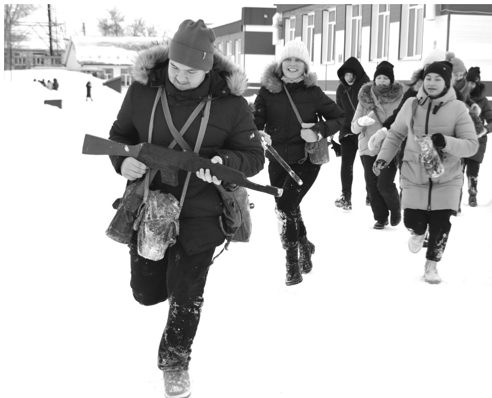
Девчонки ни в чём не уступают мальчишкам при выполнении заданий