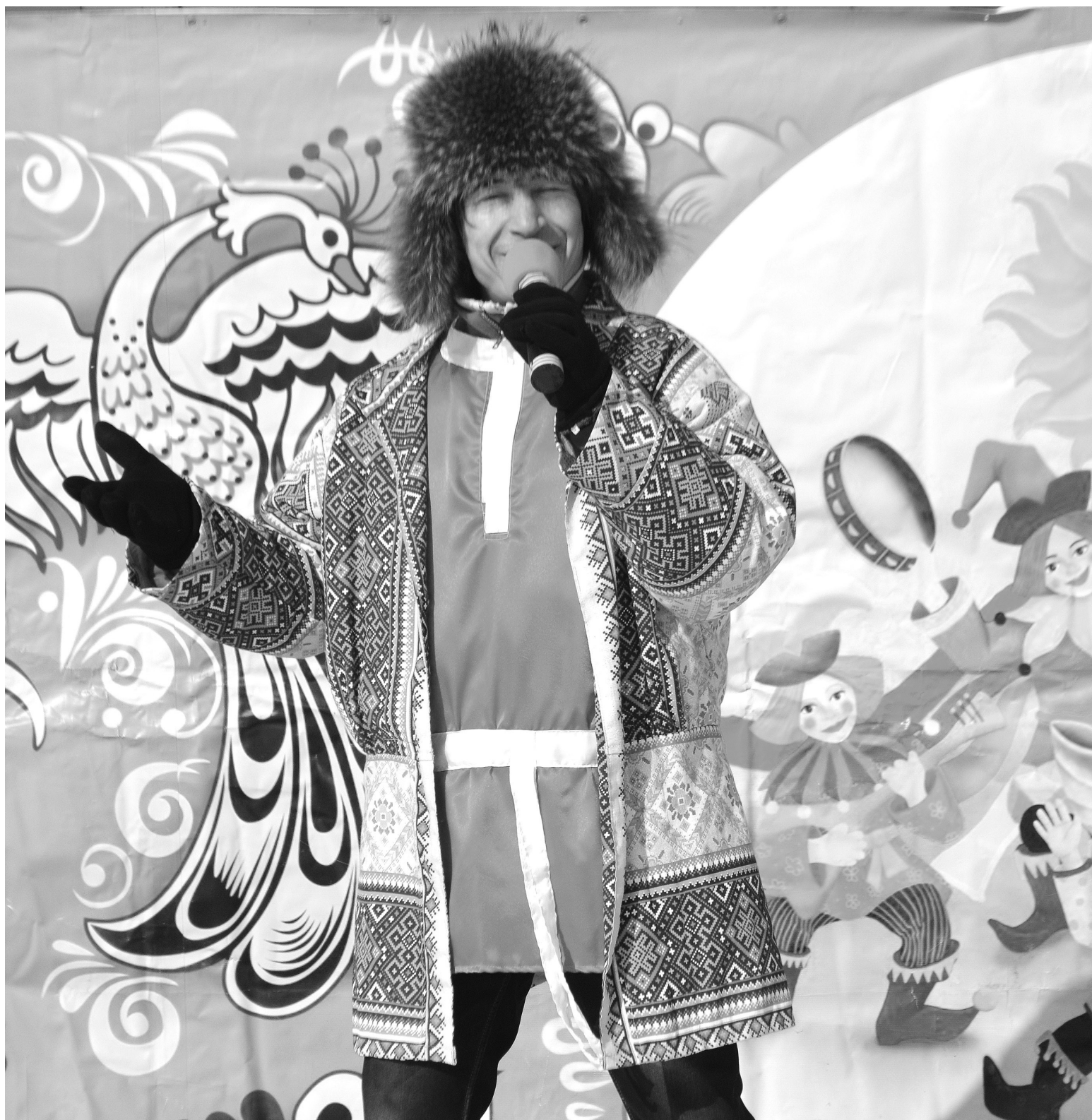
Сорокинцы любят массовые праздники с песнями и плясками