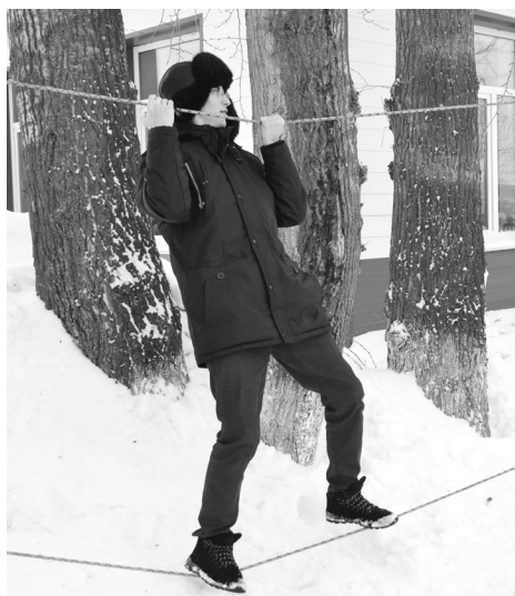
Верёвочная переправа через условный Днепр