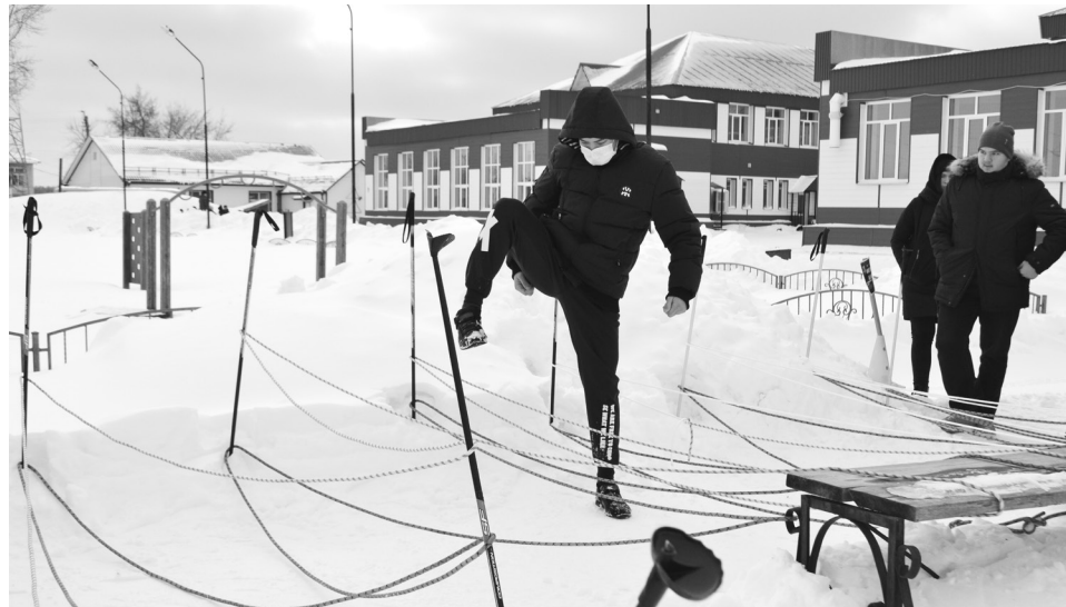
Только бы не запутаться в верёвочной паутине!

После всех испытаний, заснеженные и покрасневшиеся, девчонки и мальчишки у костра за обе щеки уплетали настоящую солдатскую кашу. Это тоже школьная зарничная традиция.