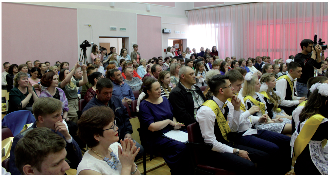
В актовом зале собрались учителя, выпускники и их родители.