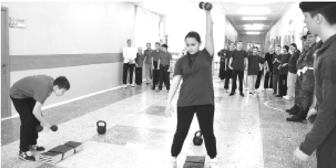
► Испытания завершились упражнениями по физподготовке

В Тобольске проходит муниципальный этап Всероссийской военно-патриотической игры «Зарница 2.0», в которой принимают участие три возрастные группы: младшая (7 – 10 лет), средняя (11 – 13 лет) и старшая (14 – 17, 18 – 21).