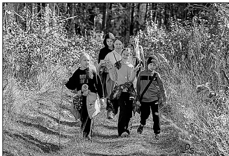
На дистанции «Тюменской тропы».

Инна ГОРБУНОВА.