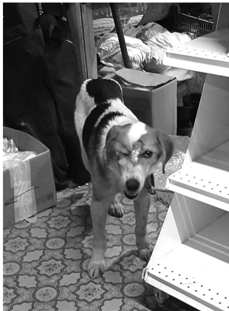
После перенесённых операций собака, которую назвали Гердой, идёт на поправку