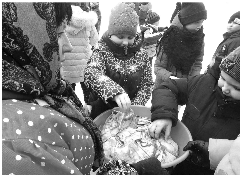
Ребятня с удовольствием угощалась блинами

весна, которой так уже заждались..., – отмечают старшеклассники.