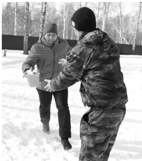
Серьёзный подход к шуточным конкурсам