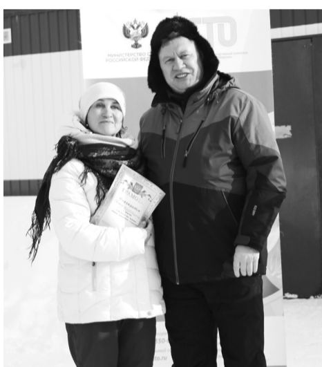
Самая приятная часть праздника – награждение