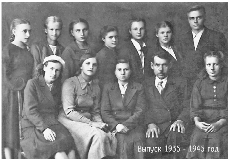
Выпуск 1935 - 1945 год