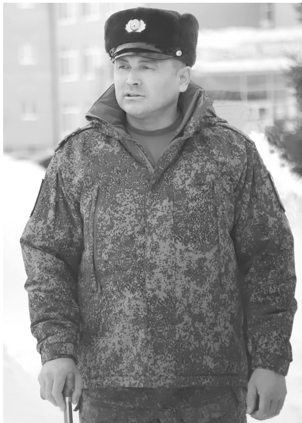
Патриотическое воспитание молодёжи — самое важное дело сегодня, считает Рустам Сайфуллин, Герой России

Тюмонец Рустам Сайфуллин проявил отвагу на специальной военной операции