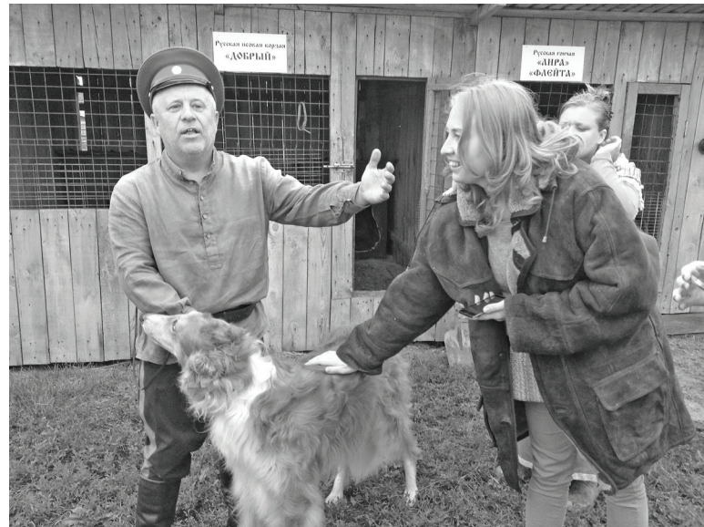
Таких собак можно было увидеть разве что в старых фильмах.

Закончился информационный тур «Широка Тавда моя родная»