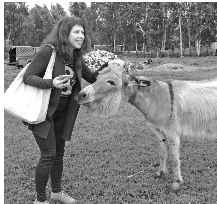
Добродушный характер у этого животного.