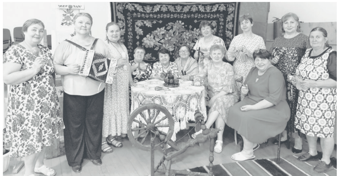
Частушечные посиделки в Липихинском сельском доме культуры.

Частушка – это короткая, ритмичная и часто импровизированная песня, появившаяся в России в середине XIX века. Она, как правило, рифмованная и посвящена актуальным событиям, исполняется под аккомпанемент народных инструментов или без него, сопровождаясь танцами и притопами. Частушка является зеркалом народной жизни, выражая его чувства и общие настроения.