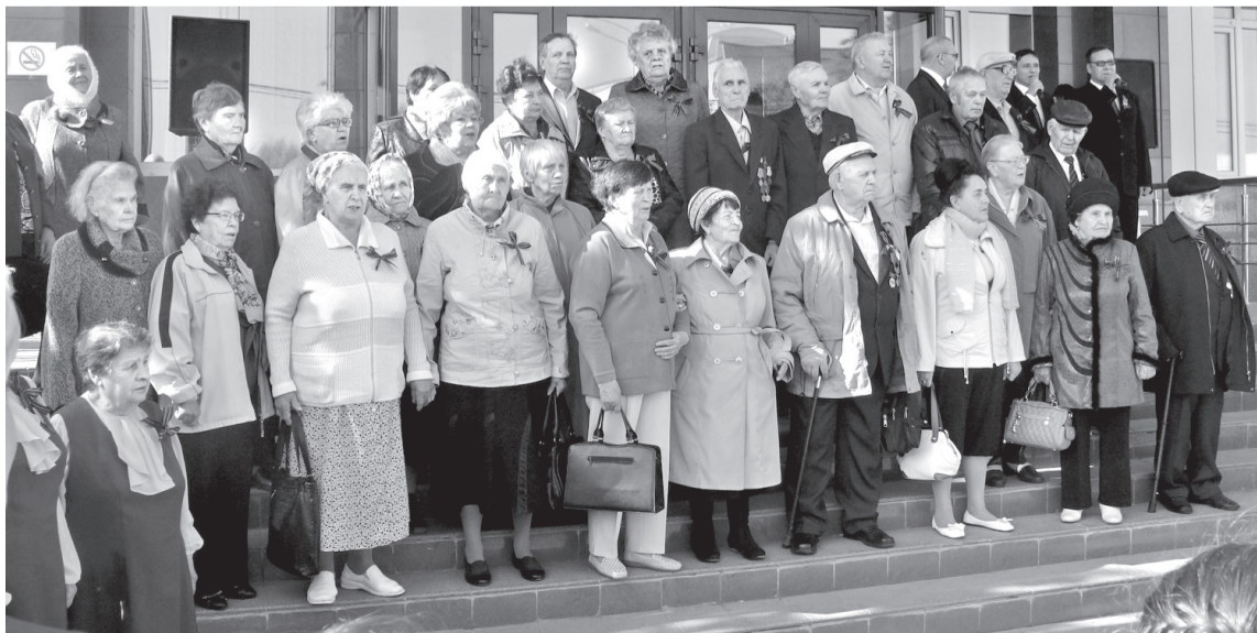
• Накануне Дня Победы заводоуковские ветераны побывали на приёме у губернатора области Владимира Якушева. Перед поездкой в Тюмень делегация вместе с городским хором «Ветеран», ансамблем «Веселушки», воспитанниками детской школы искусств и горожанами поучаствовала во всероссийском флешмобе. Все собравшиеся исполнили знаменитую песню Давида Тухманова «День Победы», которая, кстати, впервые прозвучала ровно 40 лет назад в 1975 году.