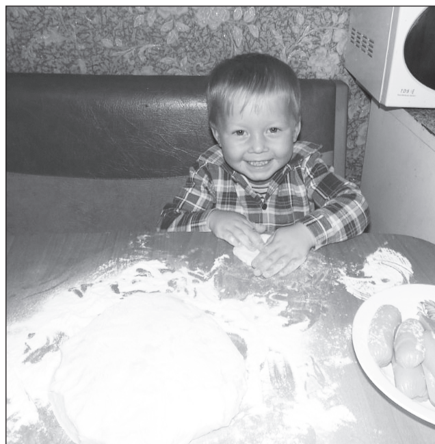
Самый младший помощник