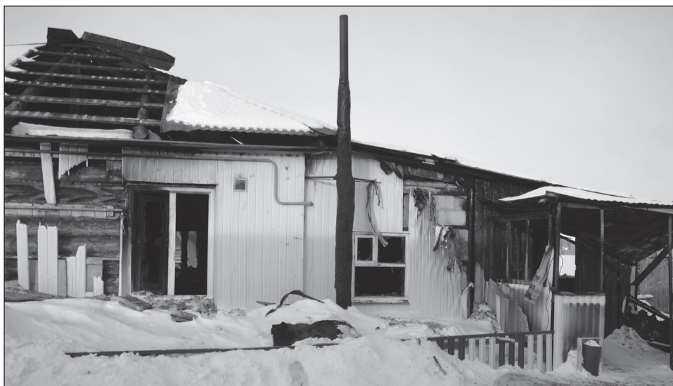
«Новогодний» вид старого дома