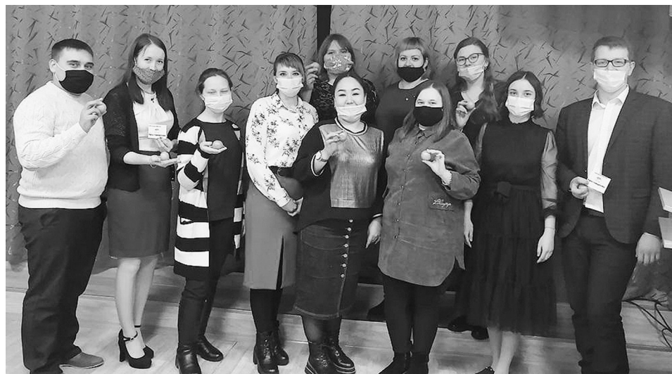
На снимке: на встрече молодых педагогов

Обучающая часть встречи была посвящена индивидуальному об-