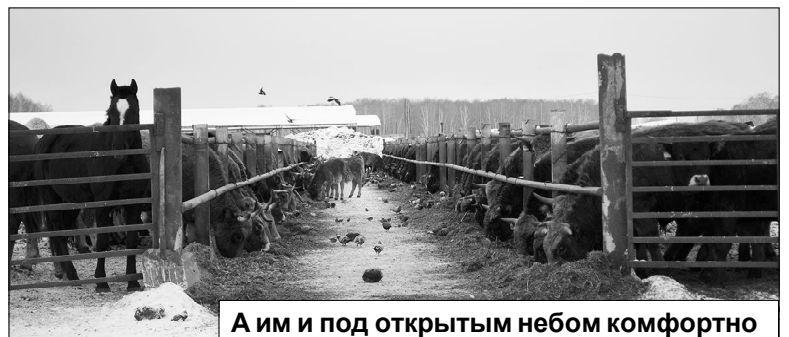
А им и под открытым небом комфортно