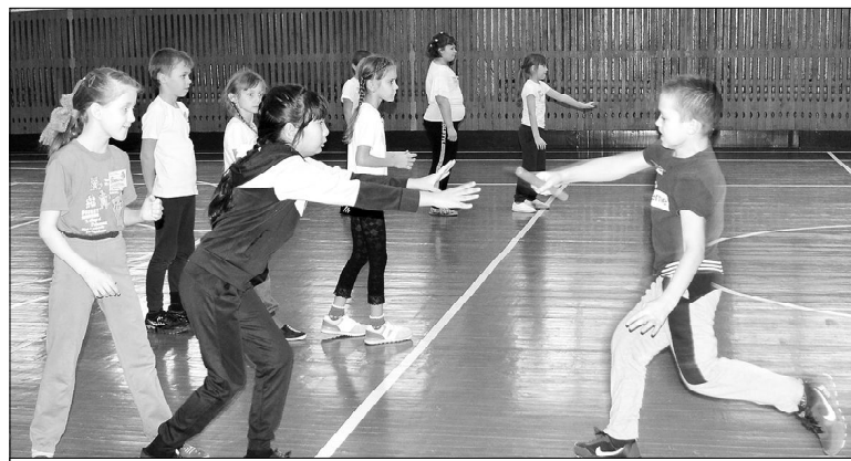
Главное – переиграть соперника

ли на обратном пути. Следующие эстафеты усложнялись, не у всех детей получалось так, как надо, но никто и не думал унывать, а лишь громче подбадривали друг друга, даже взрослые не могли сдерживать эмоций. Нелегко далась ребятишкам эстафета «Пингвины», когда пришлось передвигаться прыжками, с мячом, зажатым между колен, – он почему-то всё время норовил укатиться. В другом случае игрокам предстояло вести набивной мяч палкой, как клюшкой, что тоже довольно сложно... Много курьёзных моментов было в эстафете «Каракатица», когда участники принимали исходное положение – упор руками сзади, ногами вперёд, баскетбольный мяч лежит на животе... Вот уж, действительно, каракатица! Кто-то до поворотной отметки практически доползал на «пятой точке»... Повеселили не только себя, но и болельщиков, зато взбодрились, зарядились энергией и хорошим настроением. Время пролетело незаметно.