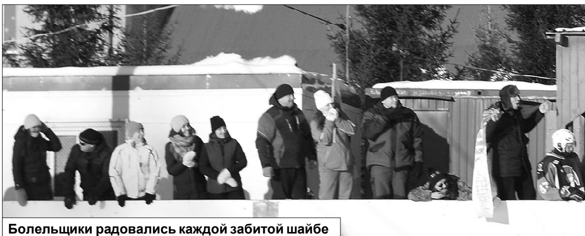
Болельщики радовались каждой забитой шайбе