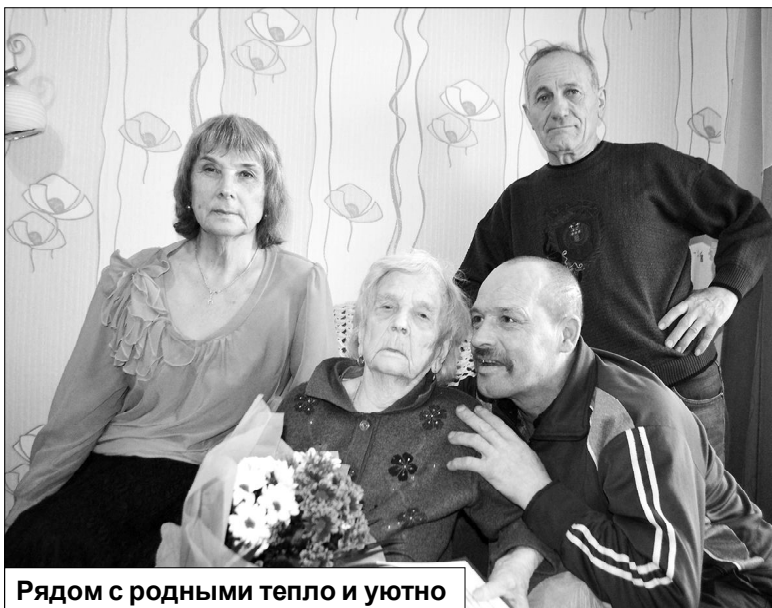
Рядом с родными тепло и уютно