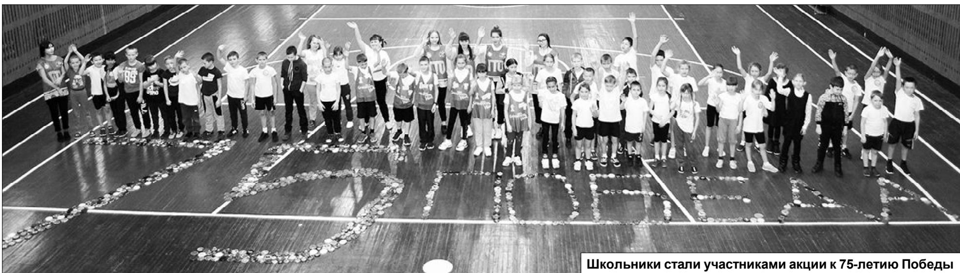
Школьники стали участниками акции к 75-летию Победы

получили сертификаты участников. Молодцы! Поздравляем!