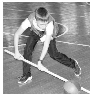
Важно – не упустить мяч

Позади осталось восемь увлекательных этапов. Пока жюри подводило итоги, девчонки и мальчишки приняли участие в акции, посвящённой 75-летию Победы в Великой Отечественной войне. Совместно с организаторами – специалистами отдела образования, Дома творчества, Физкультурно-оздоровительного центра и волонтерами – они выложили из цветных крышек логотип праздника. Получилось здорово!