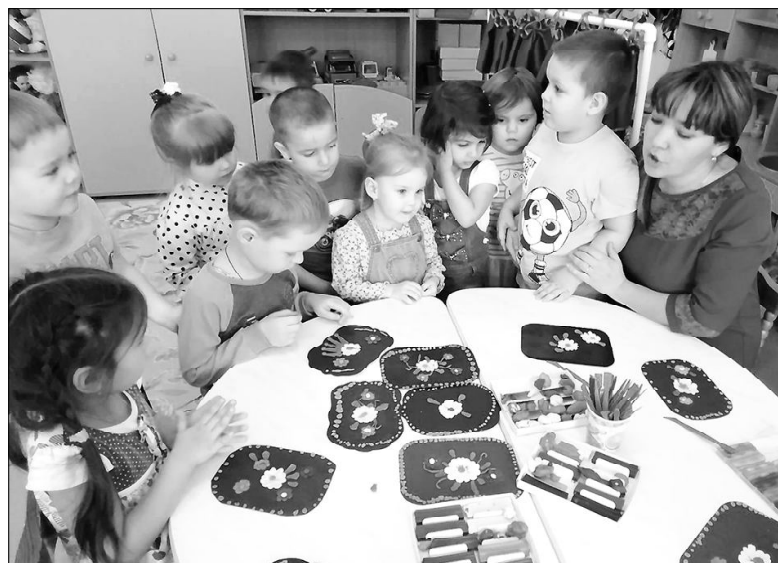
Малыши в гостях у средней группы «Рябинка»

В детском саду «Солнышко» прошла тематическая Неделя народного творчества, в которой приняли участие дети из шести групп. Воспитанников познакомили с традициями и обычаями, декоративно-прикладным искусством: дымковской росписью, а также городецкой, филимоновской, хохломской, гжельской; расширили представление о русских народных игрушках. На занятиях по изобразительности дети брали на себя роль художников и украшали изделия элементами различных росписей. Полученные знания закрепляли на музыкальных занятиях, с использованием компьютерной презентации.