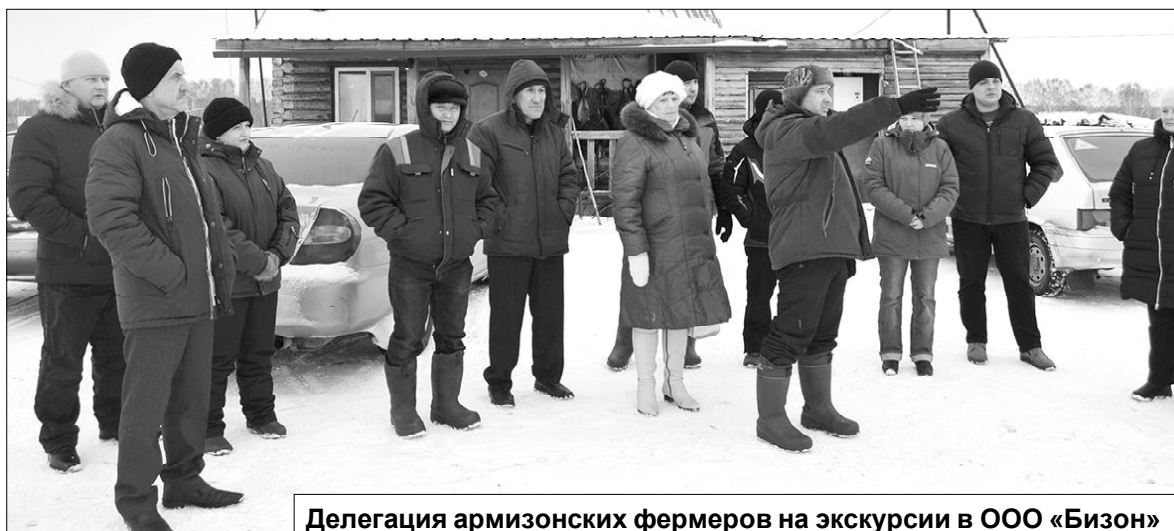
Делегация армизонских фермеров на экскурсии в ООО «Бизон»

— Представители «Бизона», заинтересованы в полноценном сотрудничестве, предлагают, на мой взгляд, самые что ни на есть привлекательные условия... Почему? Потому что стремятся к развитию, их не устраивает — что имеем, то и слава Богу. А вот у нас, уввы, таких людей можно по пальцам пересчитать! И опять вопрос — почему? А вот как-то не выработалась привычка подходить к любому делу с таких позиций — что я хочу и что я могу... Хотеть — готовы все, делать — единицы. А ведь и в районе достаточно программ поддержки, и на областном, и даже федеральном уровнях... Причем — с серьезным финансированием! Очень надеюсь, что хотя бы те, кто побывал в «Бизоне», всё хорошенько продумают и примут участие в этом деле.