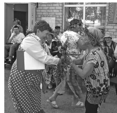
С венками провели весёлый обряд кумления. Это своеобразная клятва в дружбе и поддержке друг друга: троекратное целование через венок

«Петровские потехи» – не первое мероприятие проекта «Традиции – живая нить». В мае прошла встреча – «Печь – царица дома». Тогда организаторы украсили пространство общества в виде русской избы с печью, домоткаными дорожками, gobеленовыми коврами. И в этой, почти домашней, тёплой атмосфере вспоминали своё детство с времяпровождением на печи да на полатях. К сожалению, сейчас русские печи – редкость даже в деревнях.