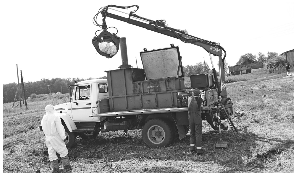
С мобилизацией всех служб Голышмановский округ оперативно ответил на предполагаемую чрезвычайную ситуацию

Более 85 специалистов разных регионов стали свидетелями слаженной работы организаций Голышмановского округа: Роспотребнадзора, Россельхознадзора, Министерства внутренних дел, МЧС, медицинских учреждений, ветеринарной и коммунальной служб.