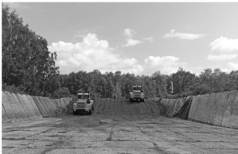
Два комбайнера трамбуют «зелёнку» тяжёлыми «Кировцами» в сенажной траншее – работа не останавливается даже ночью

Заготовка кормов набирает обороты. Для зимовки скота животноводческие предприятия Голышмановского округа заложили свыше 2600 тонн грубых кормов и более 34 тысячи тонн сенажа.