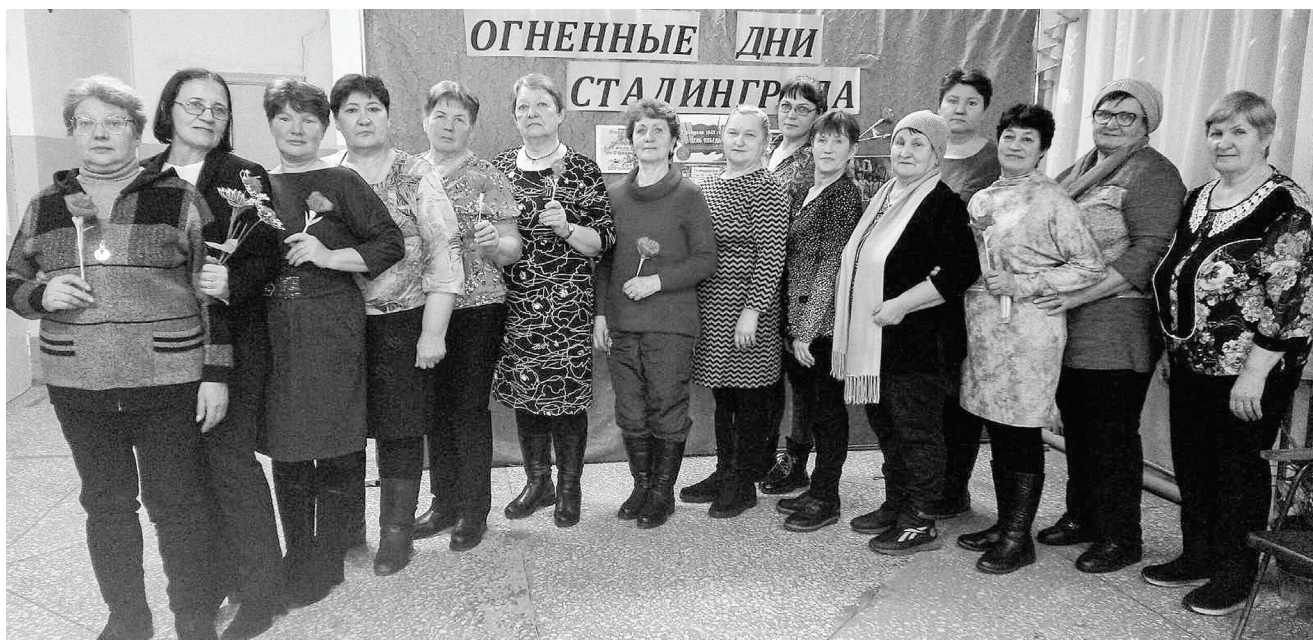
«Серебряные» волонтеры – это бескорыстные, добрые, отзывчивые люди. Они работают в тесном взаимодействии с главой поселения.