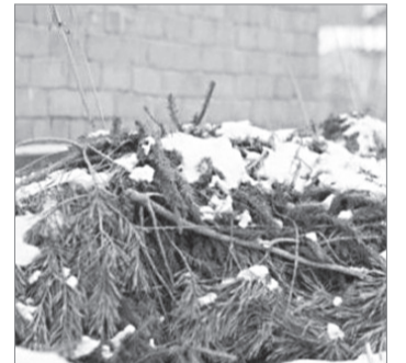
Еловые ветки – хорошее укрытие для растений в зимнюю стужу

Для многих растений самым надёжным является воздушно-сухое укрытие, которое делают из рубероида или досок, прибитых к жёсткому каркасу. Металл или камень – не лучшие материалы, от них будет больше вреда, чем пользы. Не стоит утеплять растения и бумагой или картоном. Они быстро размокнут.