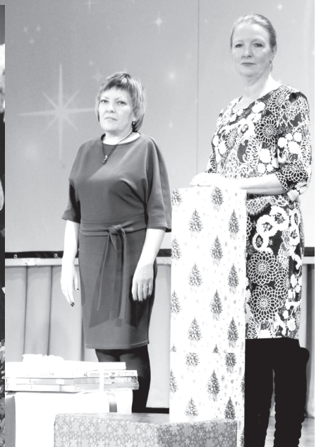
Организациям, работающим с инвалидами, вручили подарки, собранные в рамках акции «Ромашка добрых дел»