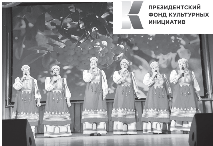
Вокальная группа «Надежда» с песней «Рябиновые бусы»

К ПРЕЗИДЕНТСКИЙ ФОНД КУЛЬТУРНЫХ ИНИЦИАТИВ