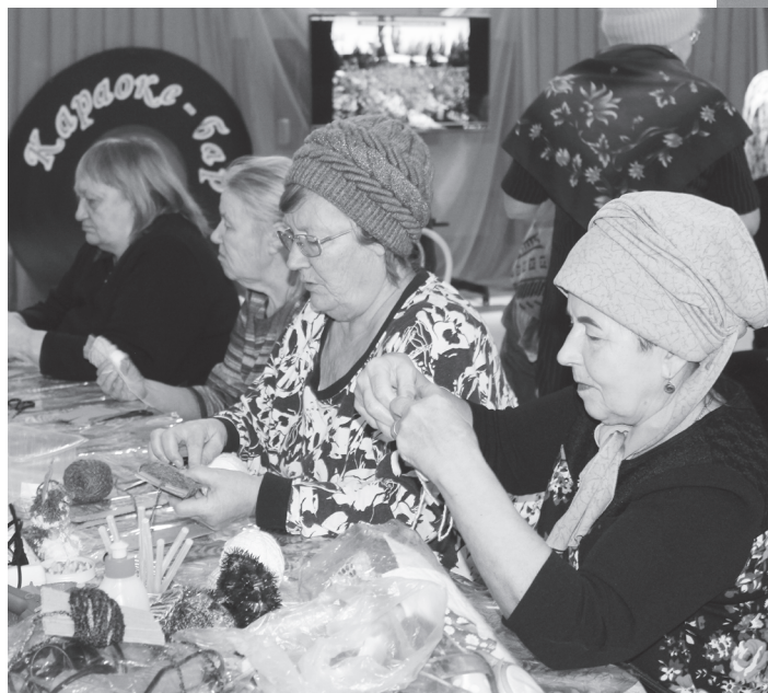
Мастер-класс «Нить добра». Каждый мог сделать кролика из пряжи