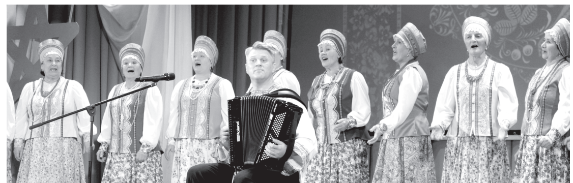
В рамках концертной программы было исполнено много ярких номеров