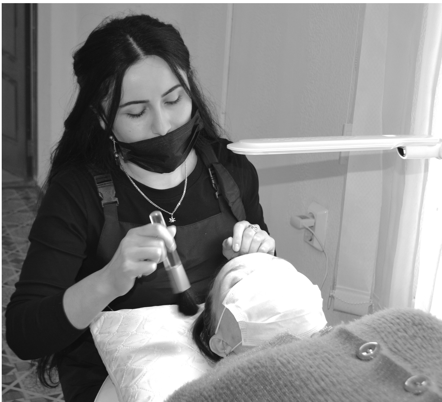
Пока клиентки расслабляются под музыку, мастер скрупулёзно выполняет свою работу