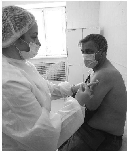
Сорокинцы активно вакцинируются от клещевого энцефалита

Внимательно осматривайте домашних животных – кошек, собак – они могут быть переносчиками этих опасных кровососущих.