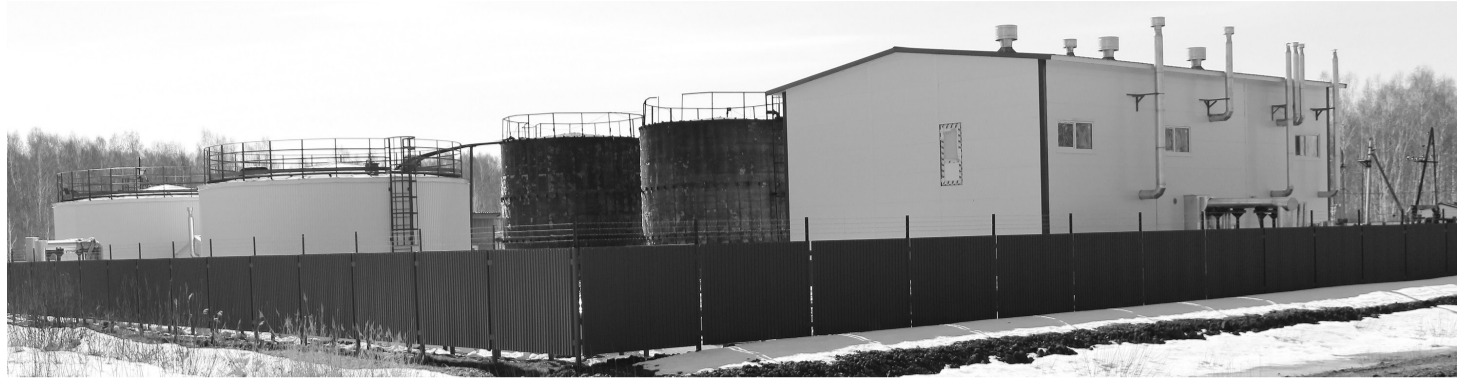
Работы по возведению станции водоочистки второй очереди близки к завершению

Водопроводные сети появятся на двадцати улицах села