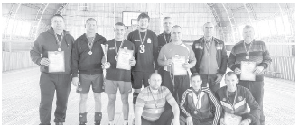
|| Фото из архива спортшколы