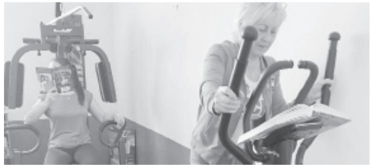
|| Фото из архива библиотеки с.Шорохово

Часто заглядывают ребяташки, которые посещают спортивные секции по волейболу, футболу, теннису и другим видам спорта.