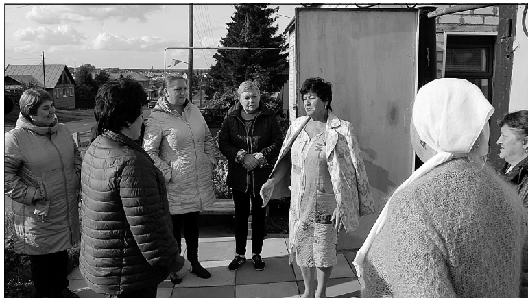
Встреча на улице Семёновых в Кулаково.

При пекарне – магазин, где продают не только разнообразные виды хлеба, пироги и кондитерские изделия собственного производства, но и полуфабрикаты: пельмени, вареники, кот-