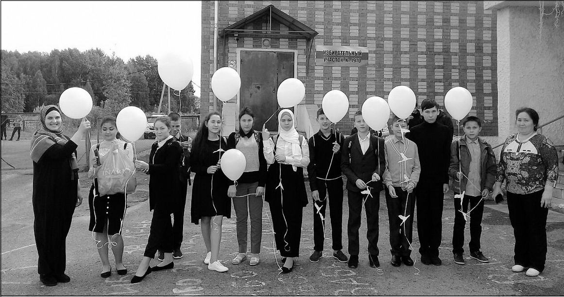
Учащиеся Акияровской школы запустили в небо белые шары.