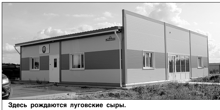
Здесь рождаются луговские сыры.