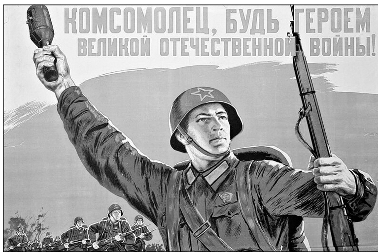
Плакат времён Великой Отечественной.