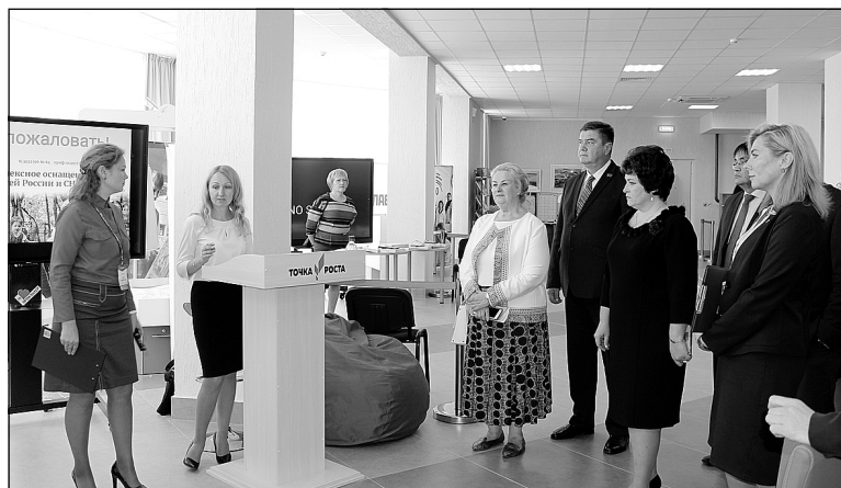
Гости образовательного салона знакомятся с площадкой «Точка роста».

Большой успех на конференции сопутствовал педагогам дошкольного образования.